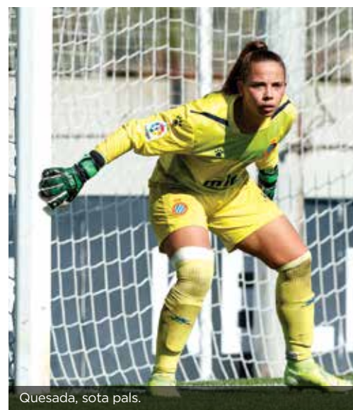
Quesada, sota pals.