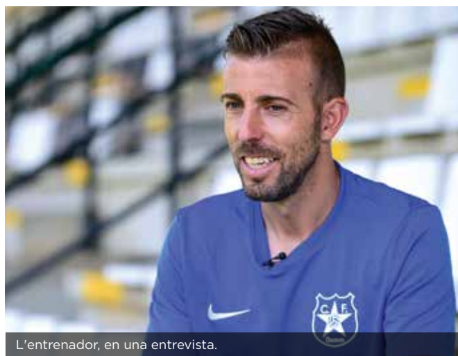
L'entrenador, en una entrevista.

No, encara més. És un club professional en futbol