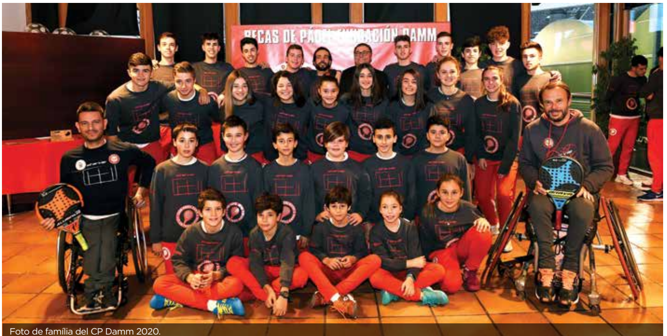
Foto de família del CP Damm 2020.

L'arribada del nou any marca l'inici d'una nova temporada de pàdel. El CP Damm va presentar el seu equip a les instal·lacions de La Finca a Pozuelo de Alarcón, la seu esportiva del Club.