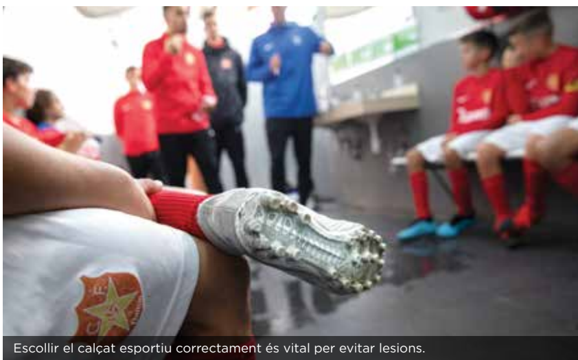
Escollir el calçat esportiu correctament és vital per evitar lesions.

Alguns dels factors més generals a considerar són el reconeixement mèdic previ a la competició, els equips de salut multidisciplinaris, el gènere i les seves implicacions fisiològiques, l'escalfament, el material, el reglament, la nutrició, la hidratació, la higiene den-