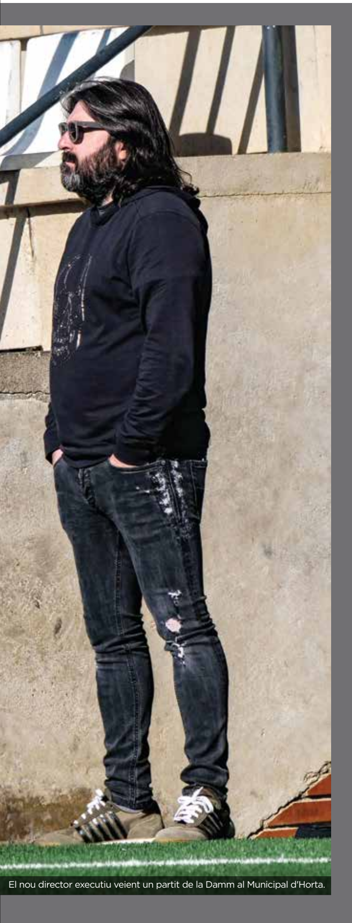
El nou director executiu veient un partit de la Damm al Municipal d'Horta.