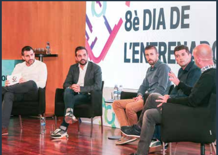
La taula rodona del 8è Dia de l'Entrenador.

En aquest sentit, l'entrenador del Juvenil A va expressar la importància