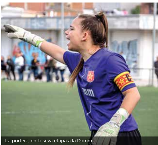
La portera, en la seva etapa a la Damm.