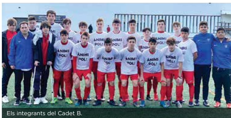
Els integrants del Cadet B.