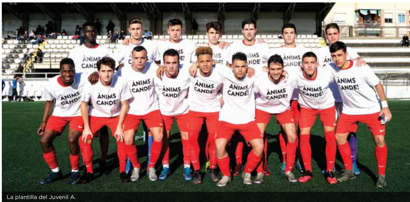
La plantilla del Juvenil A.