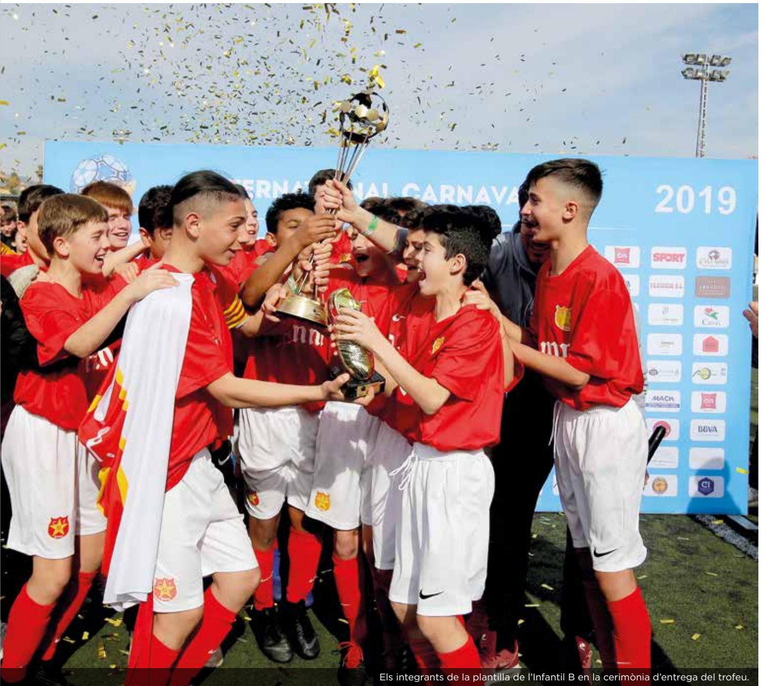
Els integrants de la plantilla de l'Infantil B en la cerimònia d'entrega del trofeu.