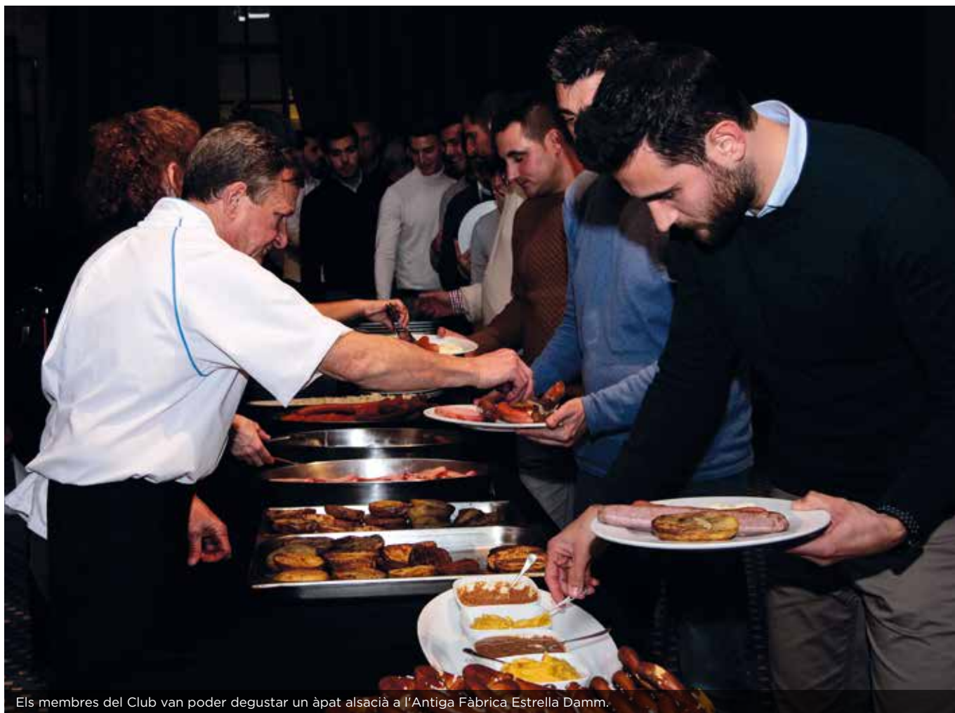
Els membres del Club van poder degustar un àpat alsacià a l'Antiga Fàbrica Estrella Damm.