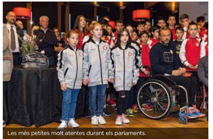
Les més petites molt atentes durant els parlaments.