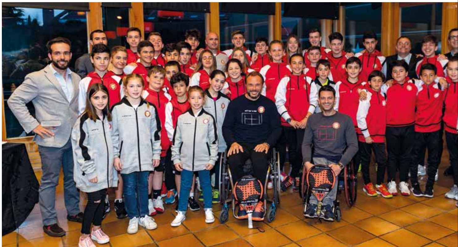
Foto de família del CP Damm.