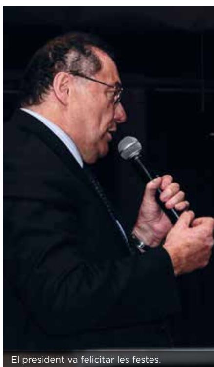
El president va felicitar les festes.