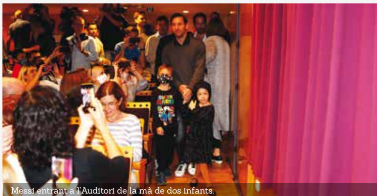
Messi entrant a l'Auditori de la mà de dos infants.