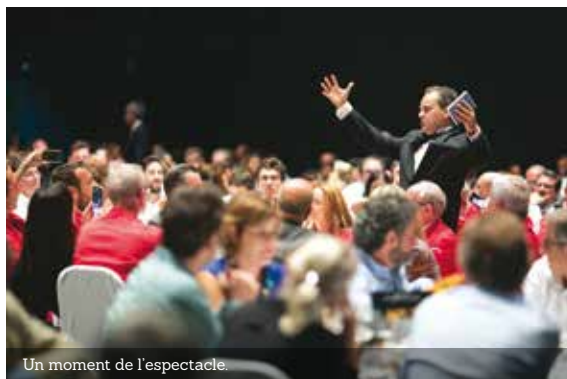
Un moment de l'espectacle.