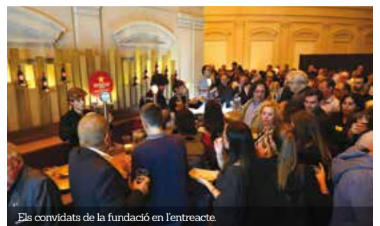
Els convidats de la fundació en l'entreacte.