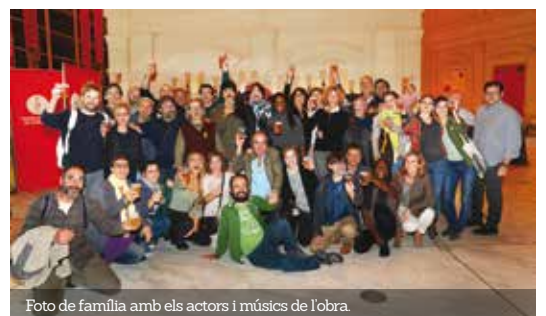
Foto de família amb els actors i músics de l'obra.