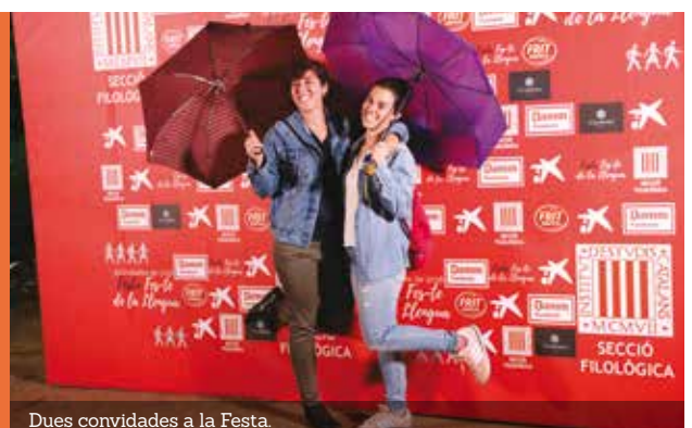
Dues convidades a la Festa.

Amb la voluntat de cohesionar els col·lectius que treballen per difondre i consolidar la llengua catalana en els àmbits pedagògics, culturals i de mitjans de comunicació, entre d'altres, l'Institut d'Estudis Catalans va organitzar la Festa "Fes-te de la Llengua". L'acte també té l'objectiu d'encoratjar la seva tasca i contribuir a ampliar la difusió de la llengua catalana i fer que aquests col·lectius se sentin més propers a la Secció Filològica. ★