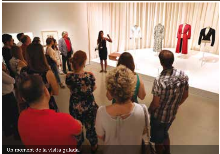
Un moment de la visita guiada.