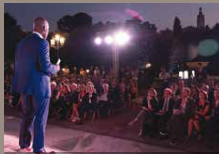
Imatge dels assistents a Hola Barcelona! Cocktail.