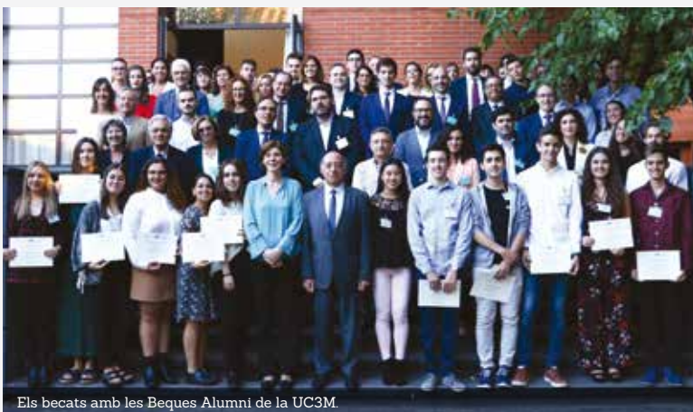
Els becats amb les Beques Alumni de la UC3M.