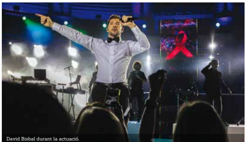
David Bisbal durant la actuació.

L a Fundació Lluita contra la Sida i el seu ambaixador, Jesús Vázquez, van organitzar una gala benèfica a la qual van acudir més de 800 assistents, entre els quals van destacar la presència de Martina Klein, Àlex Corretja, Vanesa Lorenzo, Carles Puyol, Denis Suárez, Ona Carbonell, Àngel Llàcer, Mario Vaquerizo, Bibiana Fernández, Aldo Comas, Macarena Gómez, Los Javis, Juan Avellaneda, Pelayo Díaz, Antonia Dell'Atte, Risto Mejide i Laura Escanes, entre d'altres.