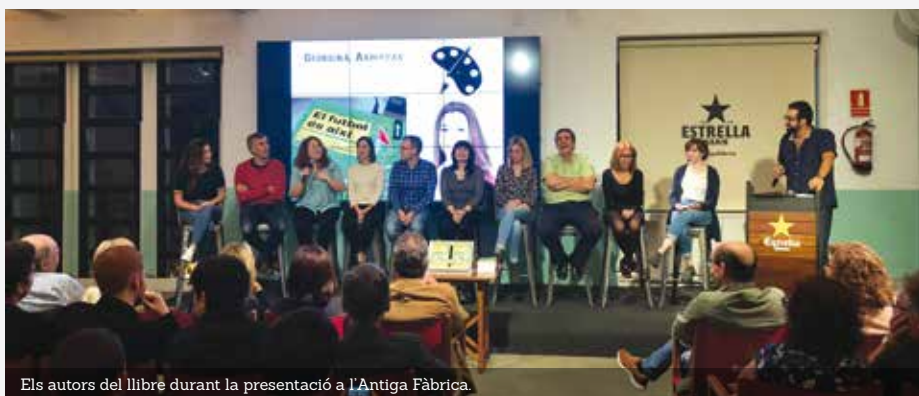
Els autors del llibre durant la presentació a l'Antiga Fàbrica.