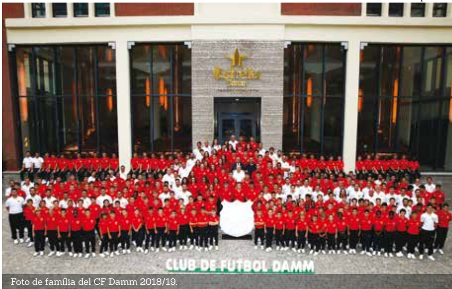
Foto de família del CF Damm 2018/19.