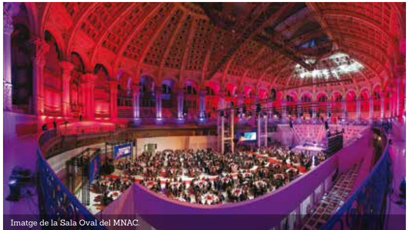
Imatge de la Sala Oval del MNAC.