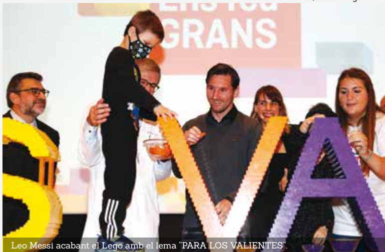
Leo Messi acabant el Lego amb el lema "PARA LOS VALIENTES".