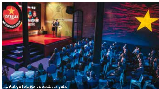
L'Antiga Fàbrica va acollir la gala.