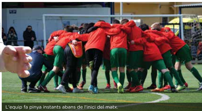
L'equip fa pinya instants abans de l'inici del matx.