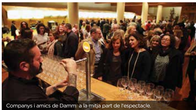
Companys i amics de Damm a la mitja part de l'espectacle.