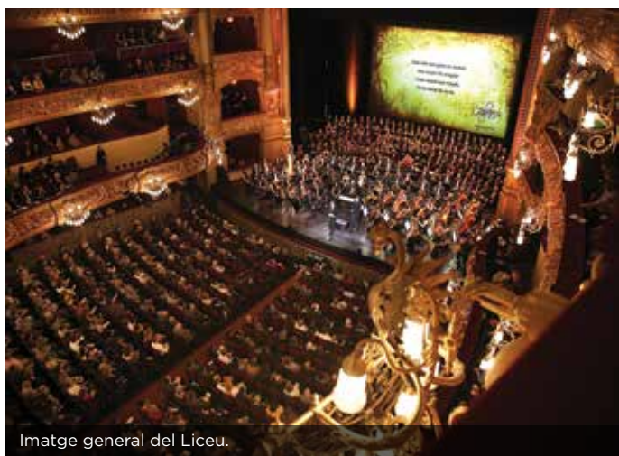
Imatge general del Liceu.