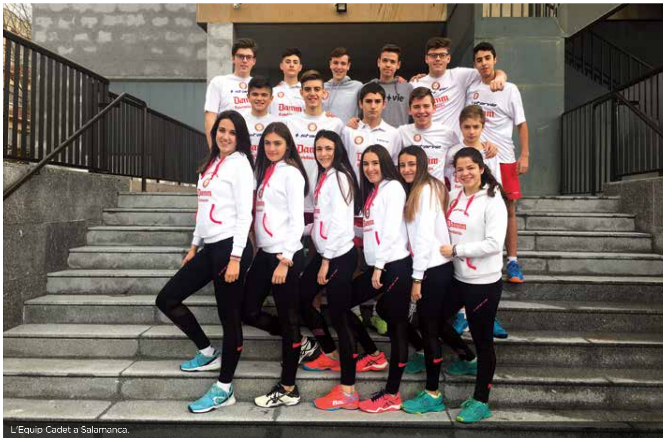
L'Equip Cadet a Salamanca.