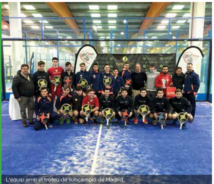
L'equip amb el trofeu de subcampion de Madrid.