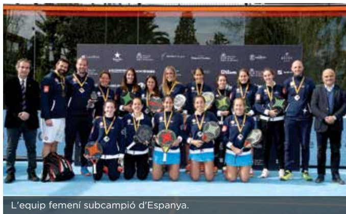
L'equip femení subcampió d'Espanya.