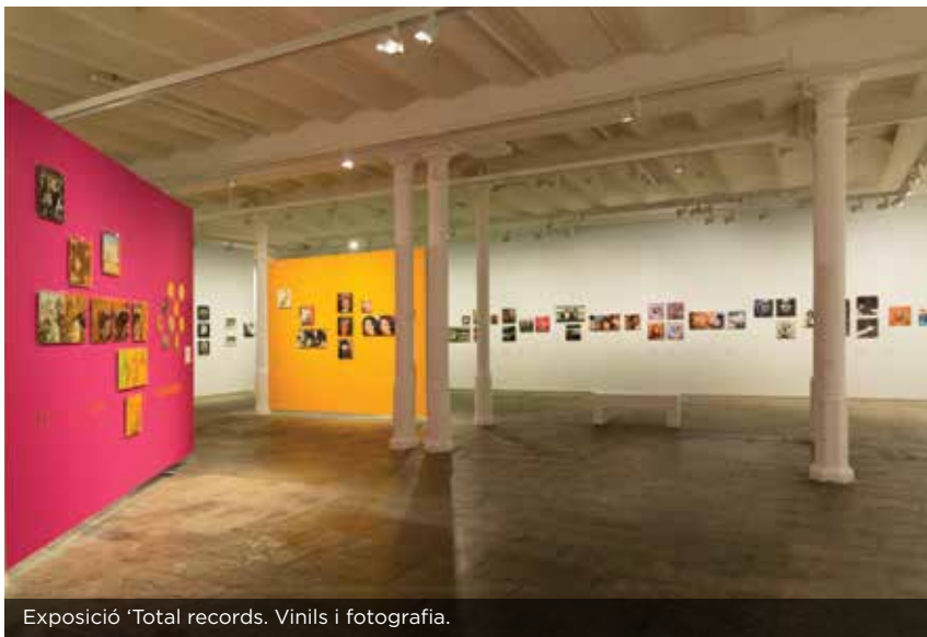
Exposició 'Total records. Vinils i fotografia.