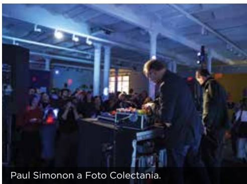
Paul Simonon a Foto Colectania.