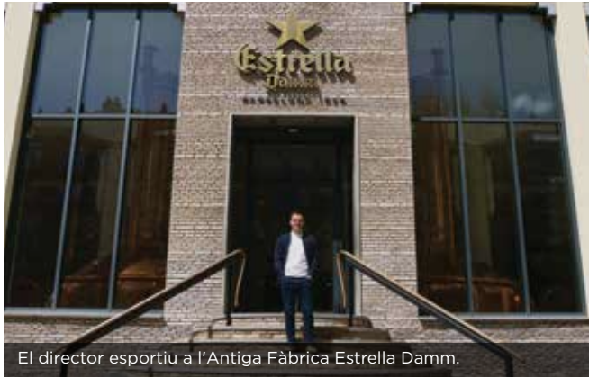
El director esportiu a l'Antiga Fàbrica Estrella Damm.