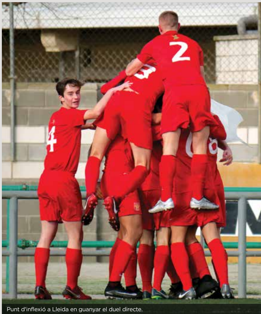
Punt d'inflexió a Lleida en guanyar el duel directe.