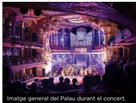
Imatge general del Palau durant el concert.

El passat 12 de març, companys i companyes de Damm van poder gaudir de l'espectacle que va oferir The Gospel Viu Choir, un grup considerat referent del gòspel nacional i europeu. El conjunt català va presentar Reload, un espectacle vital amb una gran dosi de virtuosisme musical i coral. Durant el concert, el públic del Palau de la Música va poder gaudir de la capacitat interpretativa i vocal dels seus membres i de la solidaritat de tot el grup els beneficis de l'actuació es van destinar al projecte Invulnerables de Sor Lucia Caram. Els dos-cents convidats de la Fundació Damm van poder gaudir d'aquest espectacle i d'un sopar al Foyer del Palau, gràcies a la col·laboració que la Fundació manté amb la institució de la música catalana. ●