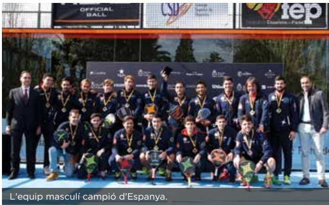
L'equip masculí campió d'Espanya.