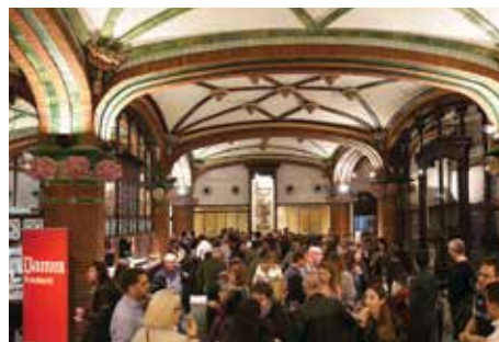
Els convidats al Foyer del Palau de la Música.