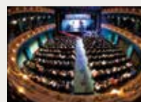
153 FILMETS Badalona Film Festival