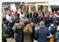
179 Reial Club Marítim de Barcelona