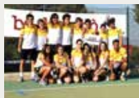
136 Atlètic Terrassa Hockey Club