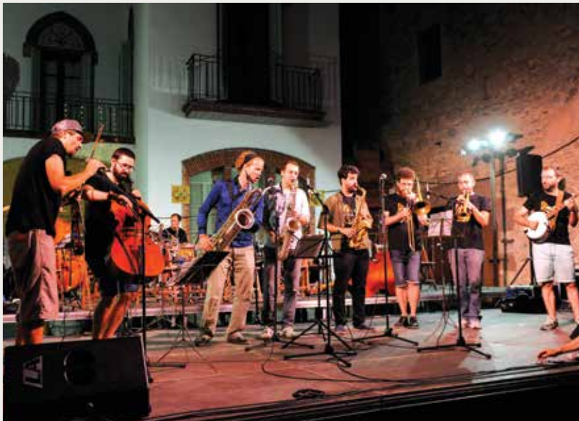
ASSOCIACIÓ D'AMICS DE LA MÚSICA D'AVINYÓ