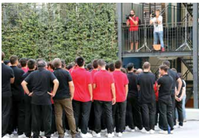
Diferents imatges de la presentació dels equips on hi va haver moments per menjar, fer fotos i divertir-se. Diferentes imágenes de la presentación de los equipos donde hubo momentos para comer, hacerse fotos y divertirse.