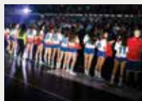
142 Club Handbol Sant Joan Despí