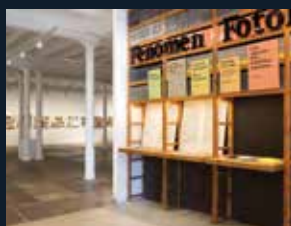
80 Fundació Foto Colectania