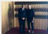
173 Media Base Sports