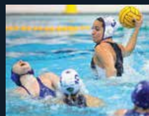
70 Club Natació Sabadell