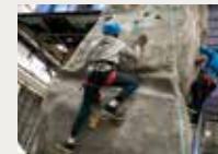
170 La Ciutat dels Somnis