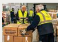
155 Fundació Banc dels Aliments