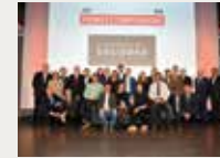
164 Fundación Empresa y Sociedad