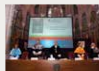
187 Universitat Abat Oliba CEU