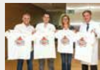
174 Projecte ARI