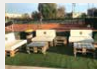
141 Club Esportiu Laietà