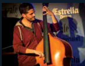
72 Conservatori del Liceu