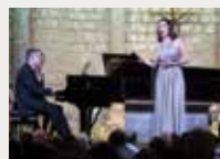
134 Associació Franz Schubert