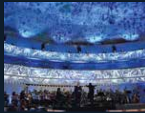
98 Gran Teatre del Liceu