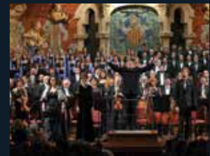
110 Palau de la Música Catalana