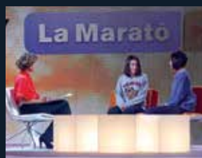
84 Fundació La Marató de TV3