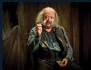
122 Teatre Nacional de Catalunya