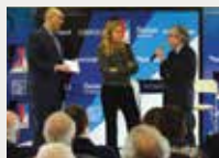
143 Club Junior FC