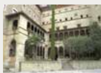
154 Fundació Abadia de Montserrat 2025