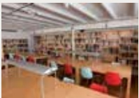
166 Fundació Gonzalo Torrente Ballester