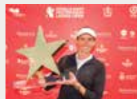
140 Club de Golf Terramar