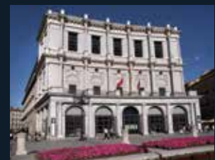
126 Teatro Real