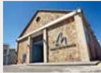
161 Fundació Promediterrània