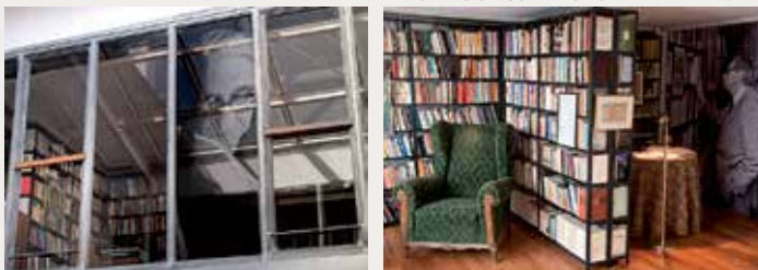
FUNDACIÓN GONZALO TORRENTE BALLESTER

La Fundació Gonzalo Torrente Ballester té com a objectiu la promoció de l'estudi de l'obra de Torrente Ballester així com la conservació del seu llegat cultural. A més, busca contribuir a la dinamització cultural de la ciutat de Santiago de Compostela mitjançant exposicions, conferències, tallers i presentacions literàries. Gonzalo Torrente Ballester va ser un novel·lista, crític, autor dramàtic i periodista gallec que va sobresortir pel plantejament i resolució irònica de les seves narracions, sovint comparat amb la resposta autòctona espanyola al realisme màgic hispanoamericà del segle XX. La seu de la Fundació està dotada amb biblioteca, auditori i sales per a l'arxiu de l'obra de l'escriptor, com articles, cartes, objectes personals, quadres i distincions, així com centenars de bobines i cintes magnetofòniques amb la seva veu.