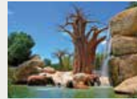
163 Fundació BIOPARC