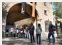
138 Biblioteca de Catalunya