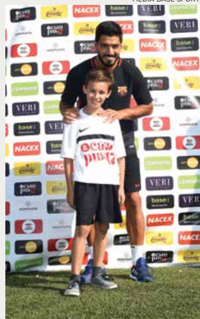
MEDIA BASE SPORTS