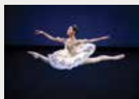
130 ARTS PROJECT