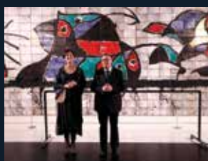
74 Corella Dance Academy