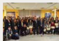
186 Universidad Carlos III