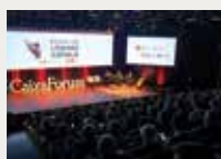
185 Unió de Federacions Esportives de Catalunya