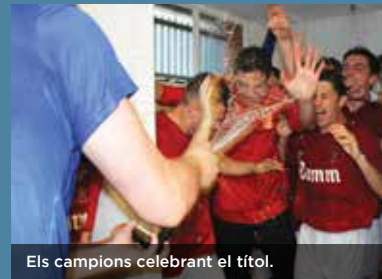
Els campions celebrant el títol.