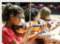
132 Associació d'Amics de la Música d'Avinyó