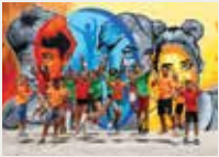
160 Fundació Privada per l'Esport i l'Educació de Barcelona