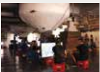
172 LOOP Barcelona