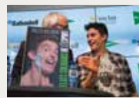
180 Relats Solidaris de l'Esport