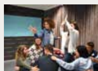
157 Fundació ESADE