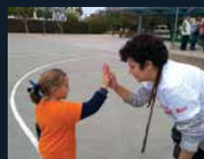
62 Autismo Sevilla