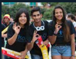
64 Casal dels Infants