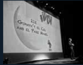
92 Fundació Pare Manel