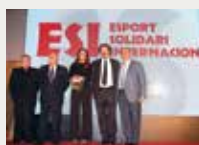
149 Esport Solidari Internacional