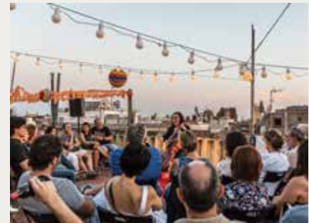
TERRATS EN CULTURA