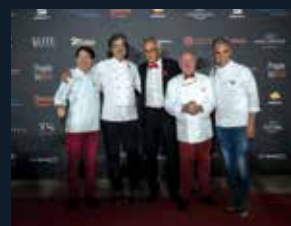
86 Fundació Lluita contra la Sida