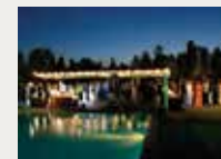
176 Real Club de Golf El Prat