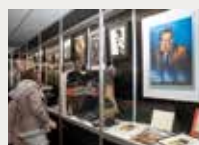
158 Fundació Iluro