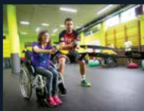
82 Fundació Isidre Esteve