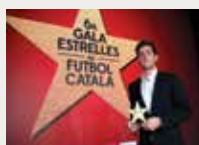
150 Federació Catalana de Futbol