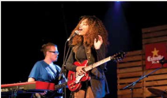
JOVENTUTS MUSICALS DE TORROELLA DE MONTGRÍ

Joventuts Musicals de Torroella de Montgrí es una entidad sin ánimo de lucro creada en 1980 con el propósito de fomentar el conocimiento y la difusión de la música. Es miembro de la Federación de Juventudes Musicales de Cataluña, forma parte de la Confederación española, con sede en Barcelona, y es miembro de la Federation of Jeunesses Musicales. El Festival de Músicas de Torroella de Montgrí se inició en 1981 con un ciclo de pocos conciertos que se celebraban en el marco arquitectónico medieval del casco antiguo, la iglesia gótica de Sant Genís, la plaza porticada gótico-renacentista y el Antiguo Convento de los Agustinos, de finales del siglo XVII. Hasta el momento, ya se han celebrado más de una treintena de ediciones y 700 conciertos con una asistencia cercana al medio millón de espectadores.