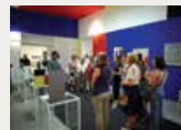
175 Real Asociación Amigos del Museo Nacional Centro de Arte Reina Sofía