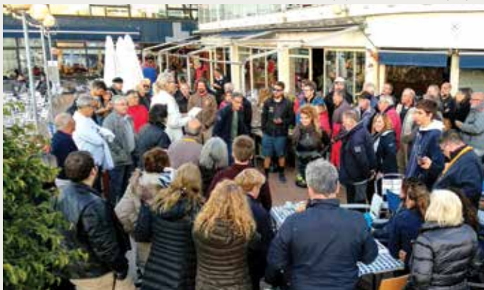
REIAL CLUB MARÍTIM DE BARCELONA