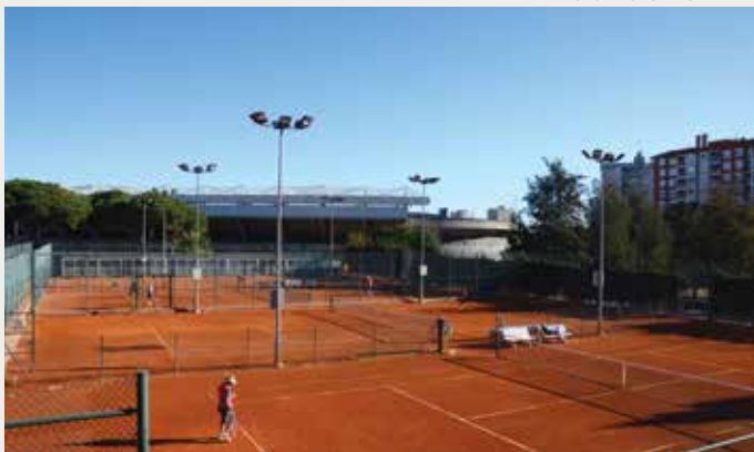
CLUB ESPORTIU LAIETÀ