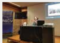
133 Associació Astronòmica Sant Cugat-Valldoreix