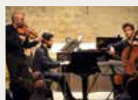
151 Festival de Música del Monestir de Cervià