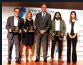
114 Sport Cultura Barcelona