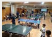
145 Club Tennis Barcino