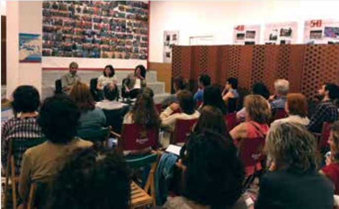
LLUÏSOS DE GRÀCIA