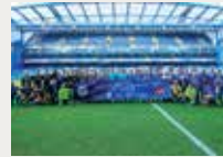
162 Fundació Tomando Conciencia