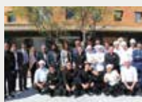
148 Escola Universitària d'Hoteleria i Turisme CETT-UB