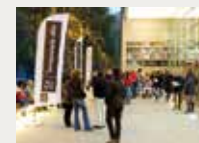
182 Temporada Alta