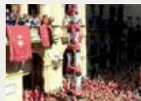
146 Colla Vella dels Xiquets de Valls