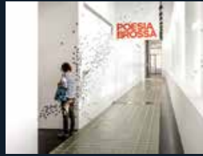
90 Fundació MACBA