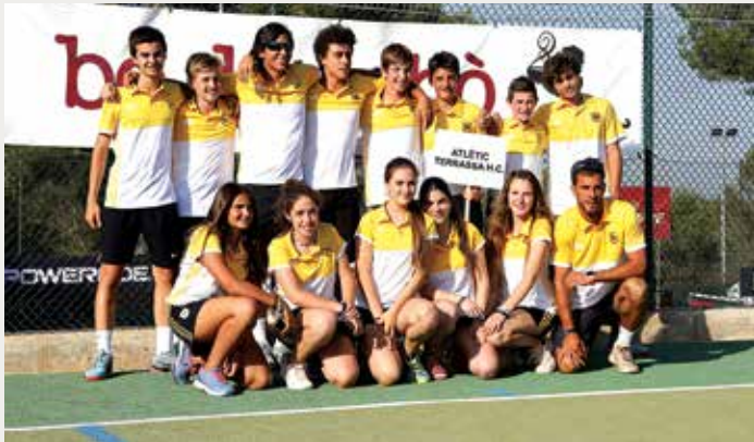
ATLÈTIC TERRASSA HOCKEY CLUB