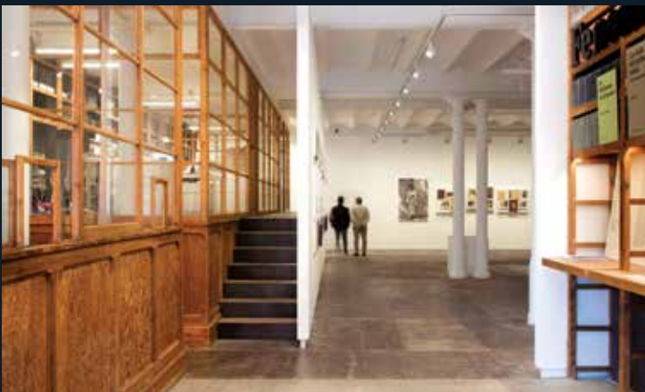
FOTO COLECTANIA HA INAUGURADO UNA NUEVA SEDE EN EL BARRIO DEL BORN DE BARCELONA DONDE PODRÁ EXPONER SU EXTENSA OBRA CON MÁS COMODIDAD PARA SUS SOCIOS Y VISITANTES.

FOTO COLECTANIA HA INAUGURAT UNA NOVA SEU AL BARRI DEL BORN DE BARCELONA ON PODRÀ EXPOSAR LA SEVA EXTENSA OBRA AMB MÉS COMODITAT PELS SOCIS I VISITANTS.