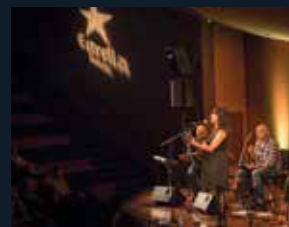
116 Teatre Auditori de Granollers