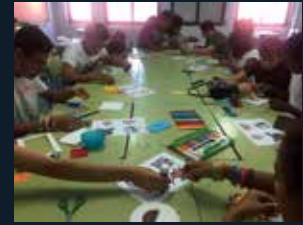
94 Fundación Balia