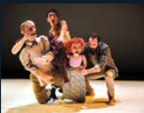
120 Teatre Lliure