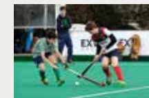
177 Real Club de Polo de Barcelona