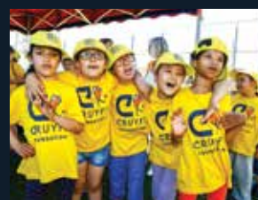
78 Fundació Cruyff