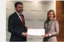
165 Fundación Fero