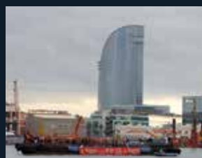
68 Club Natació Barcelona