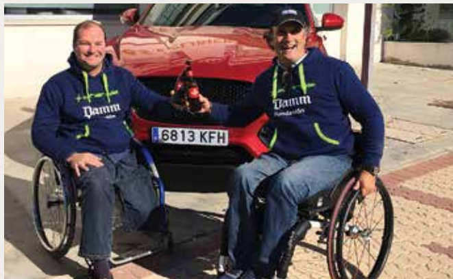
ASOCIACIÓN PARA EL FOMENTO DEL DEPORTE ADAPTADO EN ANDALUCÍA

En 2014 nació la Asociación "IN" para promover en Andalucía el deporte adaptado. Compartir a través del deporte y el ocio es su primera meta, realizando actividades de diferente índole para que las personas con discapacidad y sus familias compartan estas experiencias y éstas les ayuden a superar retos y buscar nuevos caminos. La asociación tiene como objetivo la promoción del pádel en silla de ruedas entre personas con lesiones de nacimiento o adquiridas, desde su acercamiento, planificación y seguimiento. La misión que tiene la asociación entre las personas implicadas en este proyecto es la de introducir a personas que desconocen la oportunidad que les brinda este maravilloso deporte, motivar a aquellos que han sufrido alguna lesión, realizando un seguimiento de su evolución y una planificación deportiva ajustada a sus capacidades.