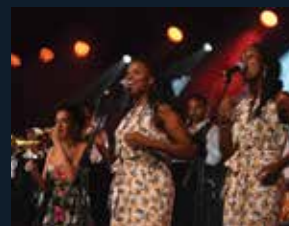
124 Teatre-Auditori de Sant Cugat