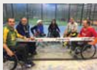
131 Associació para el foment del deporte adaptado en Andalucía