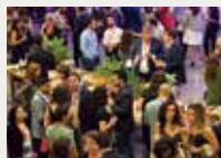
137 Barcelona Global