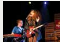
169 Joventuts Musicals de Torroella de Montgrí