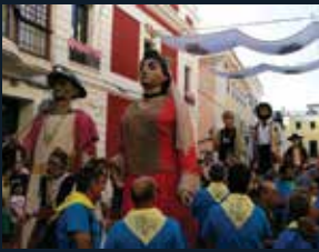
96 Geganters de Catalunya