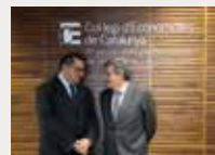
147 Col·legi d'Economistes de Barcelona