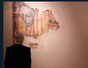
108 Museu Nacional d'Art de Catalunya