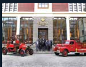
56 ACE del Cos de Bombers de Barcelona