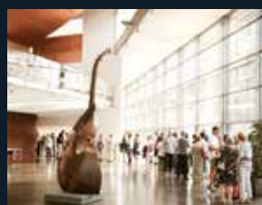
76 Fundació Auditori Palau de Congressos de Girona