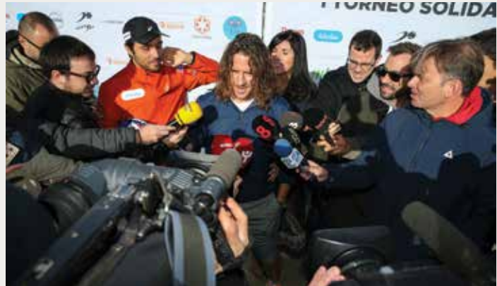
TORNEIG DE PÀDEL SOLIDARI XAP