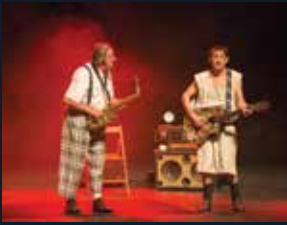
88 Fundació L'Atlàntida