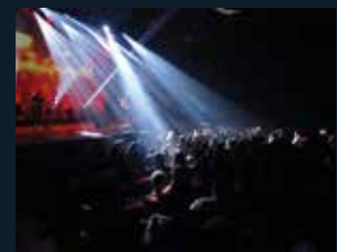
118 Teatre Kursaal