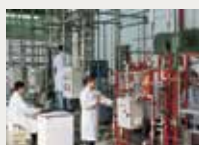
156 Fundació Empreses IQS