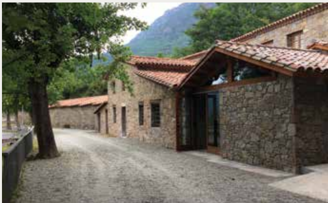
FUNDACIÓ PERE TARRÉS