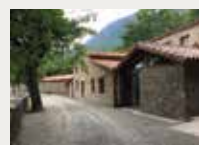
159 Fundació Pere Tarrés