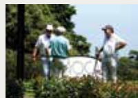
139 Club de Golf Llaneras