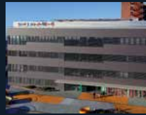
100 Hospital Sant Joan de Déu