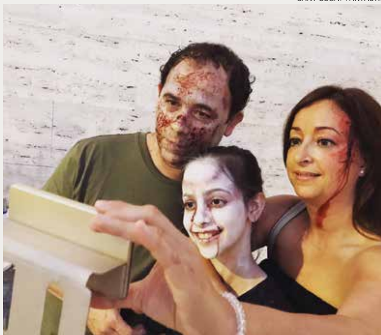
SANT CUGAT FANTÀSTIC