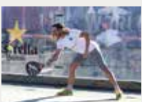
184 Torneig de Pàdel Solidari XAP