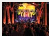
152 Festival d'Estiu d'Alella