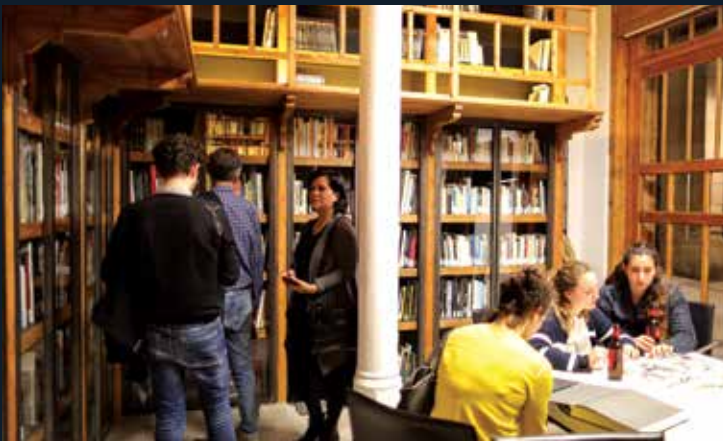
FOTO COLECTANIA HA INAUGURAT UNA NOVA SEU AL BARRI DEL BORN DE BARCELONA ON PODRÀ EXPOSAR LA SEVA EXTENSA OBRA AMB MÉS COMODITAT PELS SOCIS I VISITANTS.

FOTO COLECTANIA HA INAUGURADO UNA NUEVA SEDE EN EL BARRIO DEL BORN DE BARCELONA DONDE PODRÁ EXPONER SU EXTENSA OBRA CON MÁS COMODIDAD PARA SUS SOCIOS Y VISITANTES.