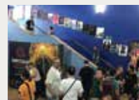
181 Sant Cugat Fantàstic