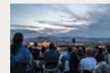
183 Terrats en cultura