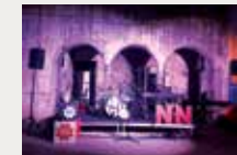
171 Lluïsos de Gràcia