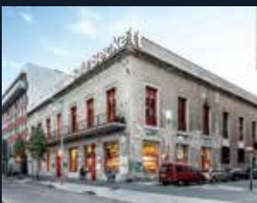
112 Sala Beckett