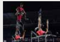
168 Invest for children