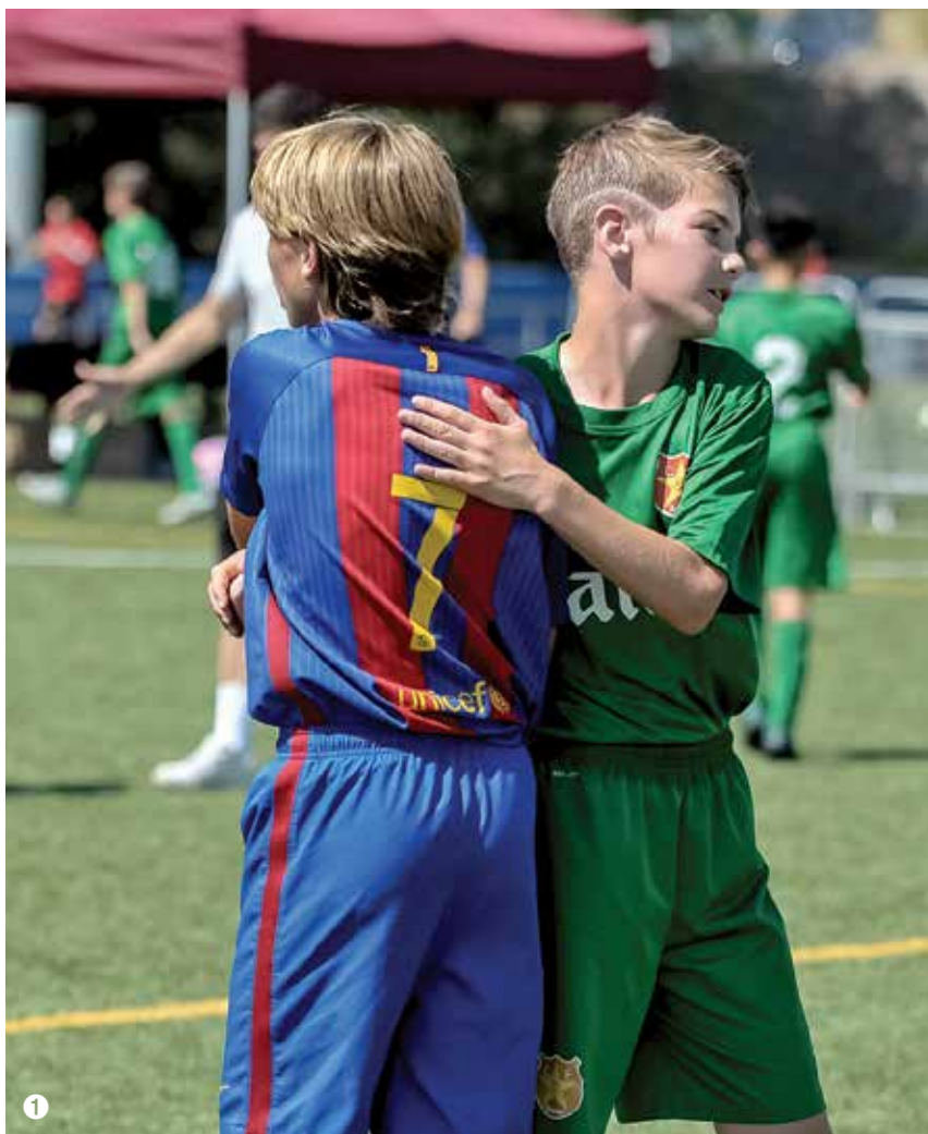
1. Esportivitat després del partit. 1. Deportividad después del partido

El CF Damm segueix consolidat com un dels millors clubs de Catalunya tant en l'àmbit esportiu com en el formatiu.