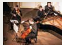
135 Associació Joan Manén