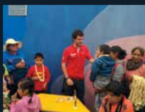
58 Atenció Precoç Solidària-Junts Podem