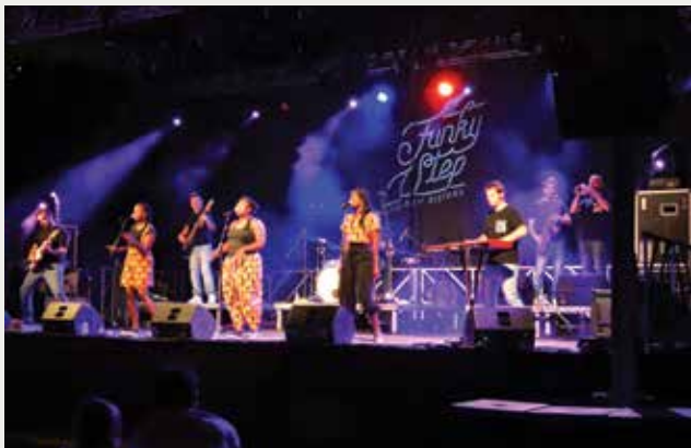
FESTIVAL D'ESTIU D'ALELLA