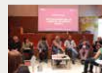
188 Universitat Ramon Llull