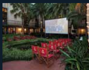
60 Ateneu Barcelonès