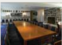
178 Real Club Náutico de Barcelona