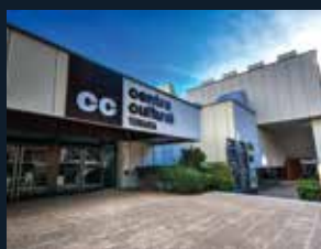
66 Centre Cultural Terrassa