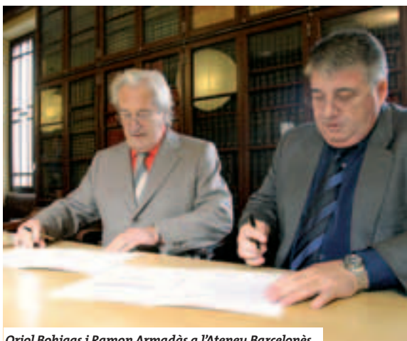
Oriol Bohigas i Ramon Armadàs a l'Ateneu Barcelonès.

La lectura va comptar amb personalitats culturals i cíviques de la població, la col·laboració dels escolars i el patrocini de la Fundació Damm i aigua de Veri.