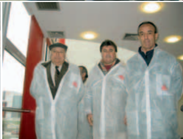
Diferents imatges de la visita a El Prat.