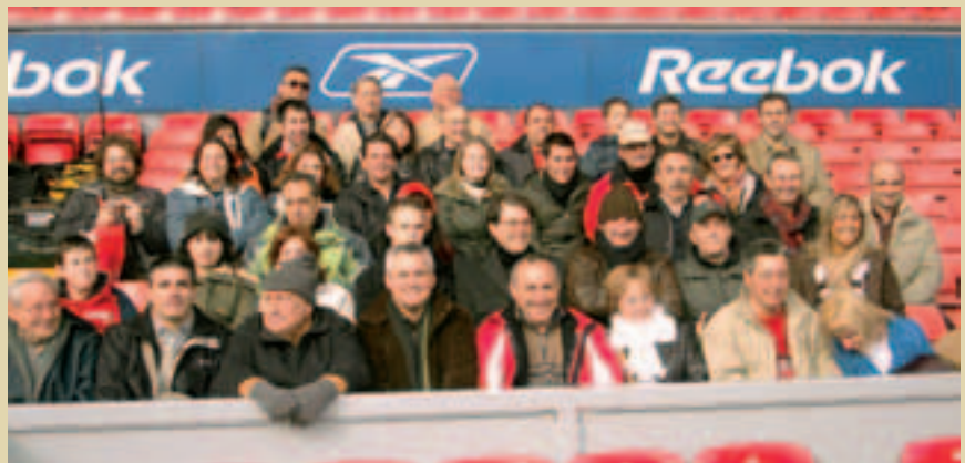
Diferents imatges de l'expedició a les instal·lacions de Melwood i Anfield.