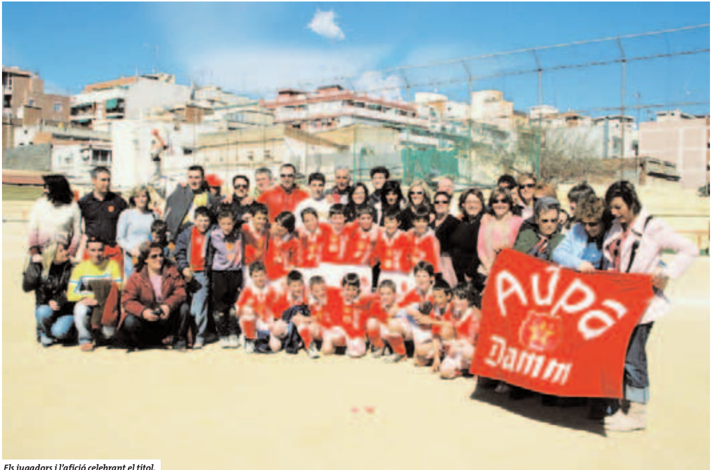
Els jugadors i l'afició celebrant el títol.