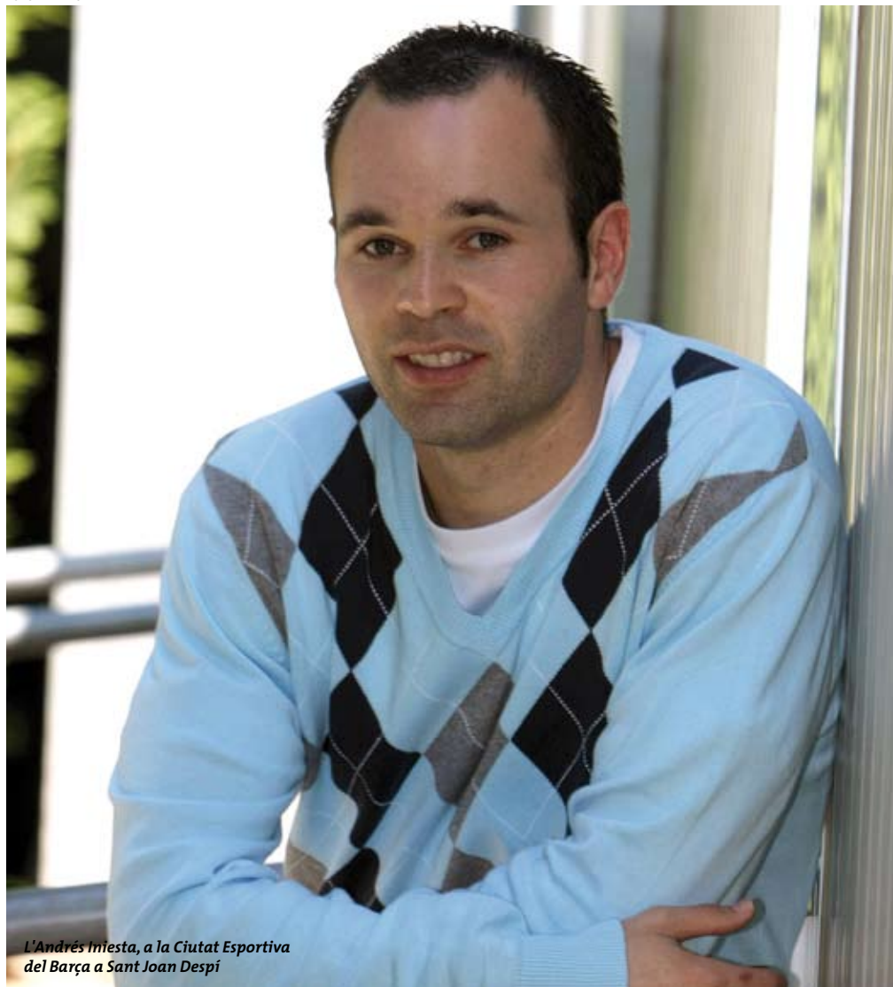
L’Andrés Iniesta, a la Ciutat Esportiva del Barça a Sant Joan Despí

millor jugador del torneig li va donar ni més ni menys que el seu referent, en Pep Guardiola, que aleshores ja va pronosticar que l’Andrés acabaria trepitjant algun dia el Camp Nou. El febrer de 2001, amb només 16 anys, el Llorenç Serra Ferrer ja el va cridar per entrenar-se amb el primer equip, i dos després, el 5 de gener de 2003, ja va debutar amb els grans al Camp Nou contra el Recreativo, amb Louis van Gaal a la banqueta. Des d’aleshores, bons i mals moments, alguns combinats el mateix dia,