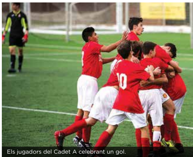
Els jugadors del Cadet A celebrant un gol.

Els equips de l'entitat ja són en marxa. Un inici majoritàriament positiu.