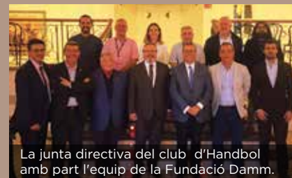
La junta directiva del club d'Handbol amb part l'equip de la Fundació Damm.

La Fundació ha subscrit un conveni per recolzar el handbol formatiu i femení del nostre país. I ho fa de la mà del club Handbol Sant Joan Despí, fundat l'estiu de 1958 gràcies a l'entusiasme d'un grup de afeccionats. En l'actualitat està format per 210 jugadors i 160 jugadores, sent l'entitat de Sant Joan Despí amb més equips i esportistes femenines. ●