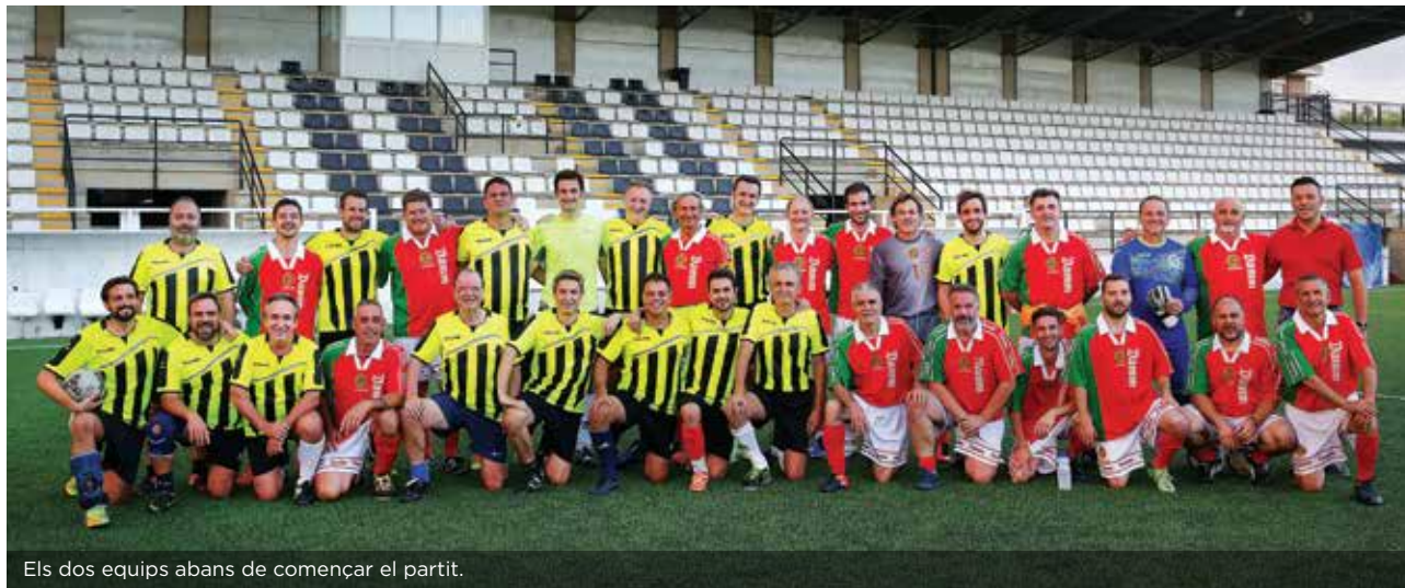
Els dos equips abans de començar el partit.