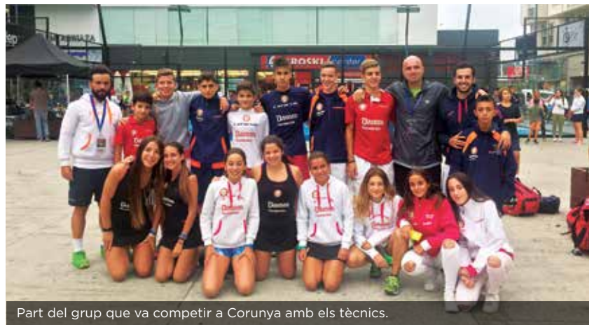
Part del grup que va competir a Corunya amb els tècnics.