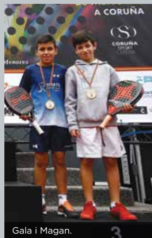
Gala i Magan.

Els nostres esportistes són alguns dels millors jugadors i jugadores de l'Estat i, per això, sovintegen els pòdiums dels tornejos on competeixen.