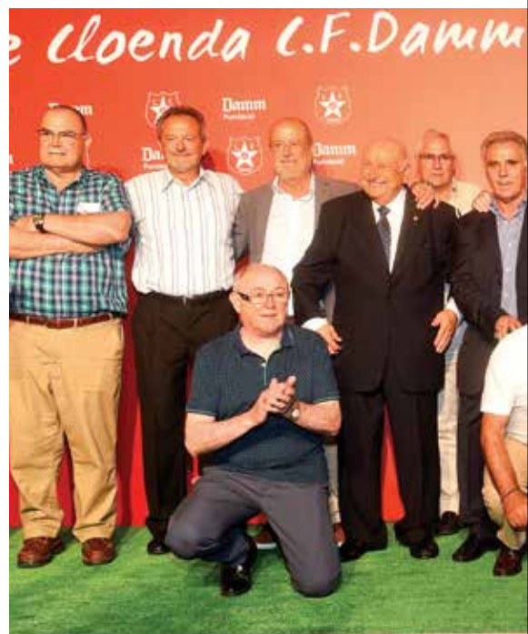
Homenatge als subcampions de la Copa del Rei.