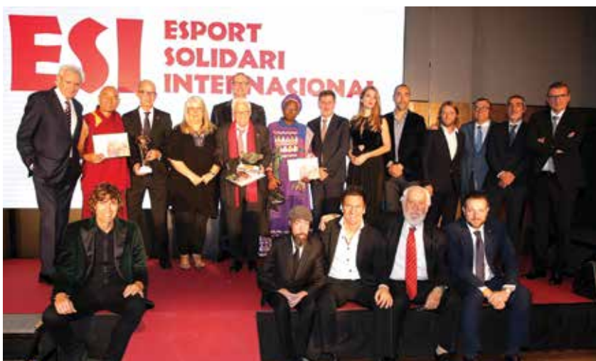
Foto de família amb els premiats i alguns dels convidats al sopar solidari.