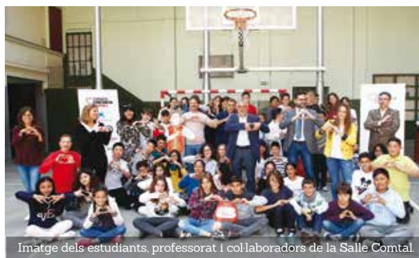
Imatge dels estudiants, professorat i col·laboradors de la Salle Comtal.

La Fundació Tomando Conciencia té com a objectius motivar un canvi d'actitud a la societat perquè entre tots puguem fer un món millor, mitjançant la recerca de recursos econòmics per donar suport a projectes socials i a través de la comunicació com a motor de canvi.★