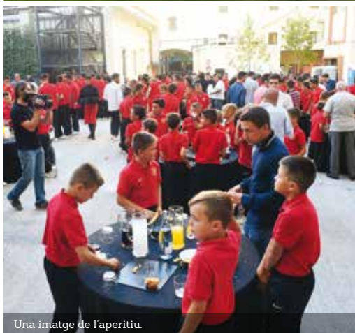
Una imatge de l'aperitíu.