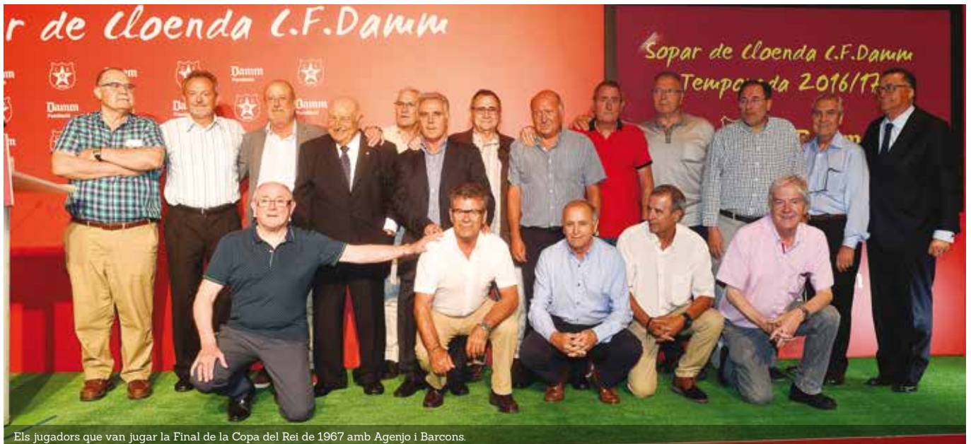
Els jugadors que van jugar la Final de la Copa del Rei de 1967 amb Agerjo i Barcons.