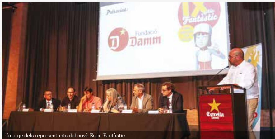
Imatge dels representants del novè Estiu Fantàstic.

El passat dimecres, 21 de juny, es va celebrar la presentació d'Un Estiu Fantàstic amb la presència de les parts implicades.