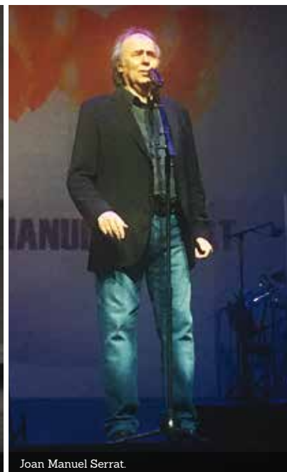
Joan Manuel Serrat.