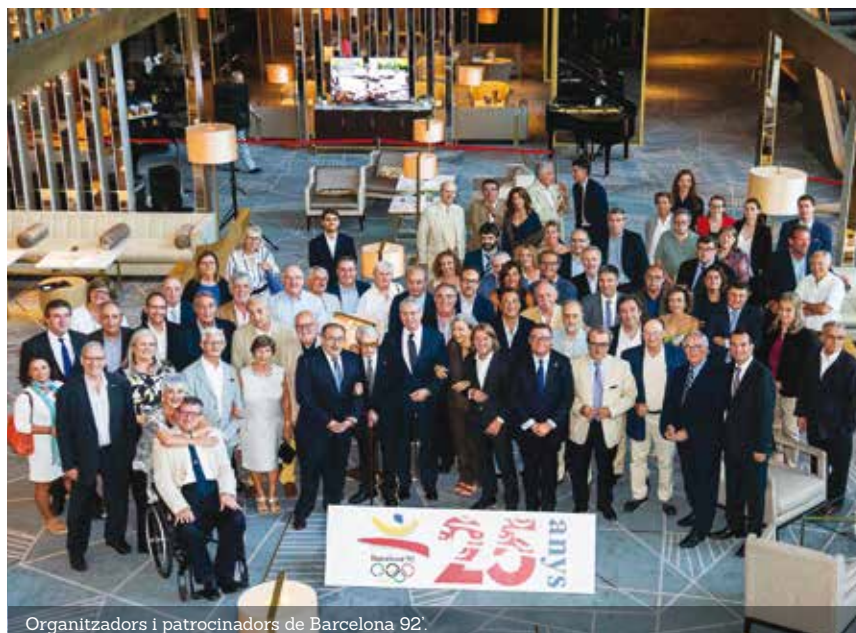
Organitzadors i patrocinadors de Barcelona 92.