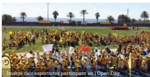
Imatge dels esportistes participant en l'Open Day.

E l Complex Esportiu municipal de La Mar Bella va acollir una nova edició de la jornada Open Day que organitza la Fundació Johan Cruyff. En total, més d'una vintena d'activitats van permetre a gairebé un miler de joves i nens gaudir d'una jornada lúdica i esportiva. La Fundació Cruyff, amb el suport d'altres entitats com ara la Fundació Dammm, dedica anualment