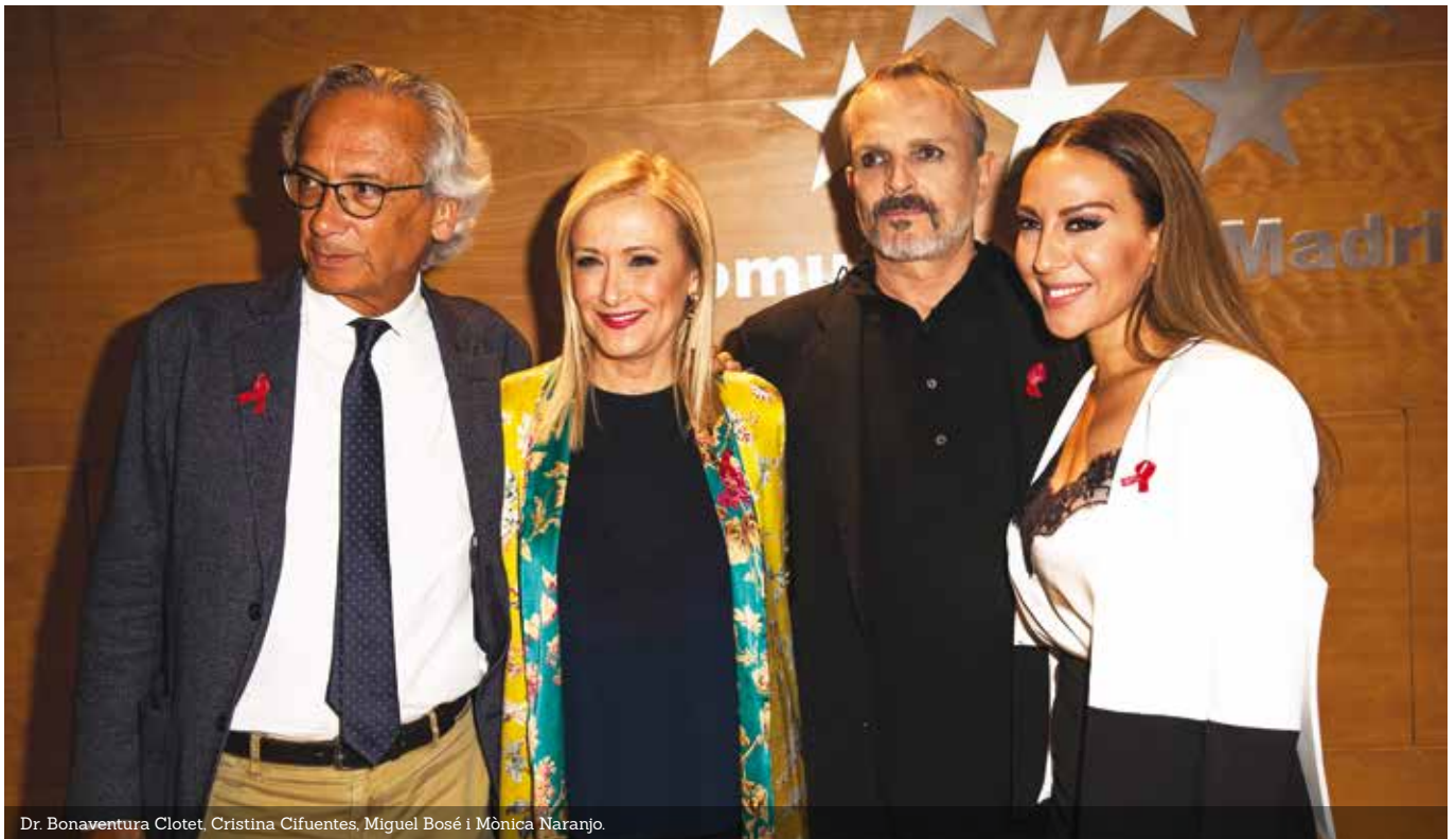
Dr. Bonaventura Clotet, Cristina Cifuentes, Miguel Bosé i Mónica Naranjo.