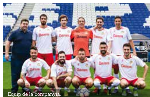
Equip de la companyia.