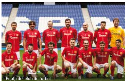
Equip del club de futbol.