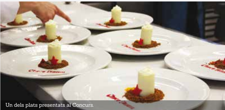
Un dels plats presentats al Concurs.