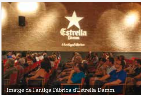
Imatge de l'antiga Fàbrica d'Estrella Damm.