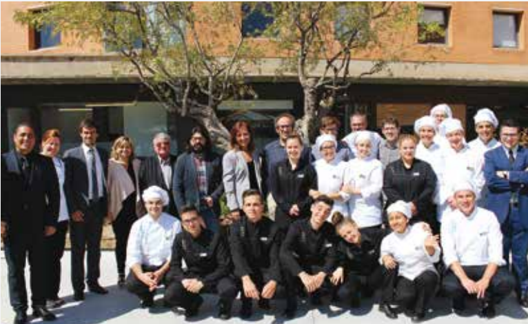
Alumnes i professors del CETT amb els membres del jurat.