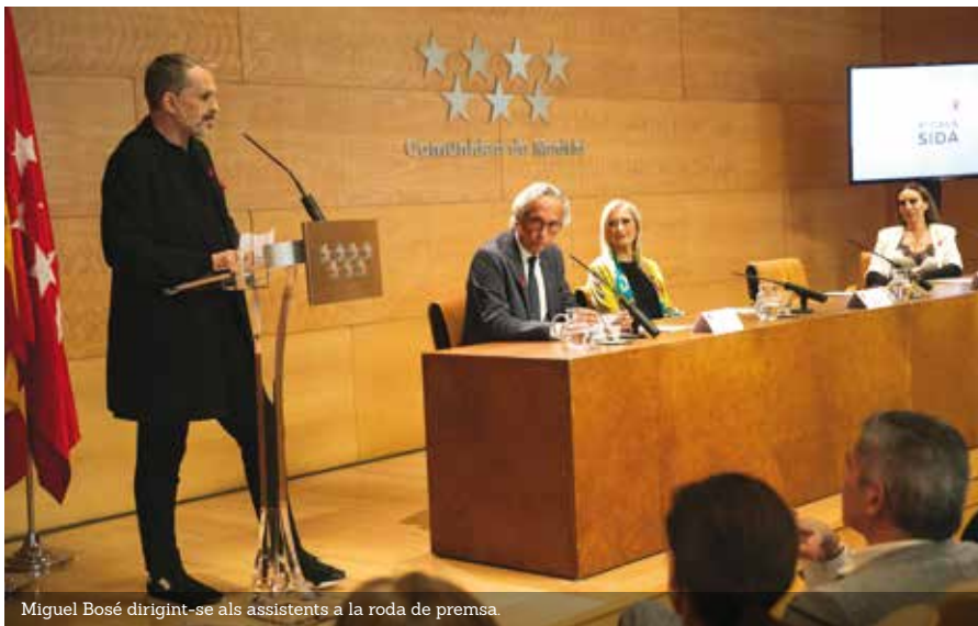
Miguel Bosé dirigint-se als assistents a la roda de premsa.