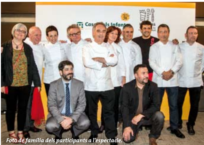
Foto de família dels participants a l'espectacle.