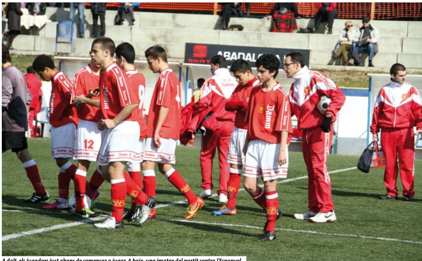
A dalt, els jugadors just abans de començar a jugar. A baix, una imatge del partit contra l'Espanyol.