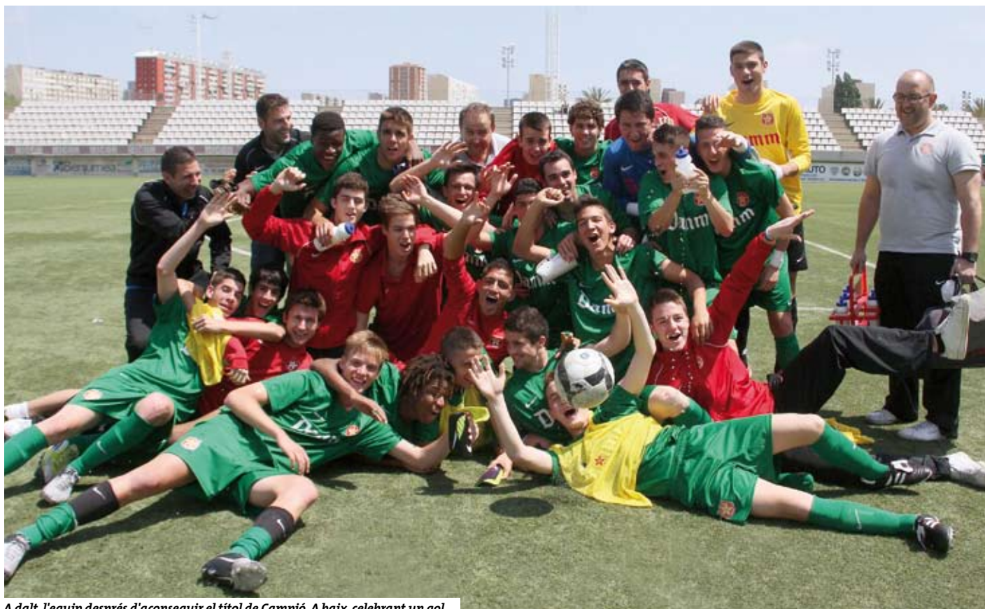
A dalt, l'equip després d'aconseguir el títol de Campió. A baix, celebrant un gol.