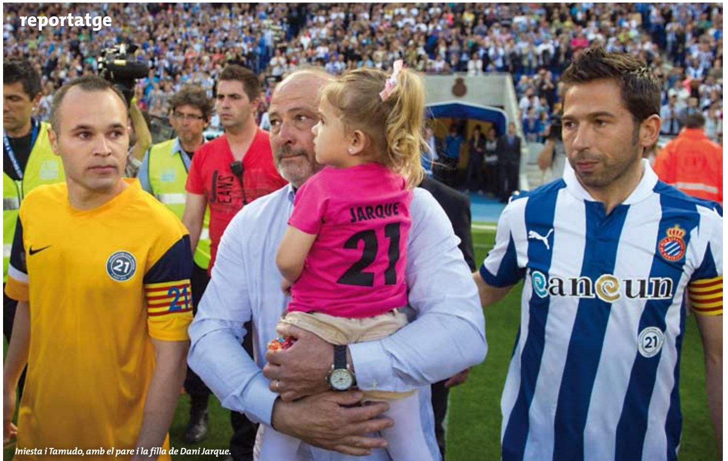
Iniesta i Tamudo, amb el pare i la filla de Dani Jarque.