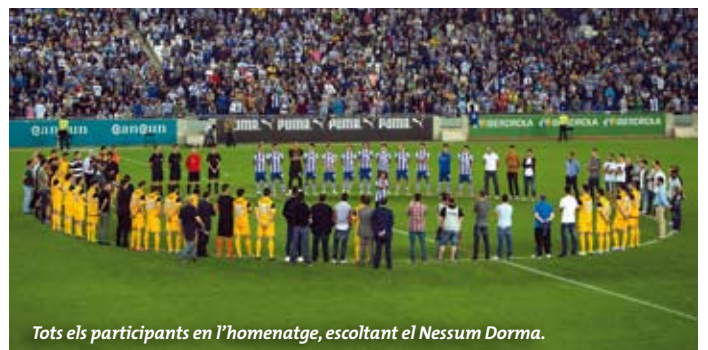
Tots els participants en l'homenatge, escoltant el Nessum Dorma .

La darrera emoció de la nit va ser la interpretació del Nessum dorma de Puccini, amb tots els futbolistes junts al centre del camp i l'afició a les grades de Cornellà-El Prat. ■