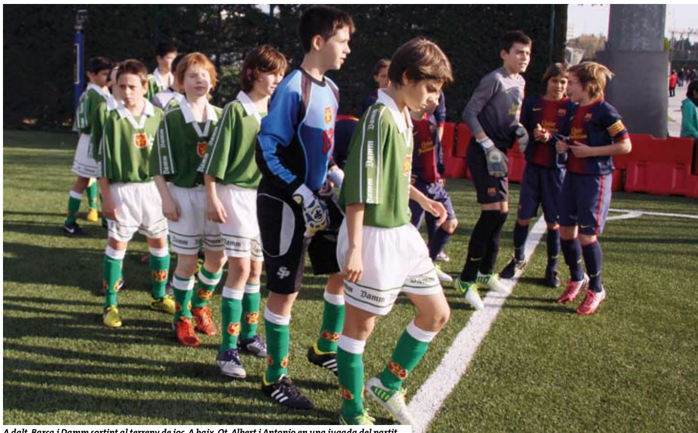
A dalt, Barça i Damm sortint al terreny de joc. A baix, Ot, Albert i Antonio en una jugada del partit.