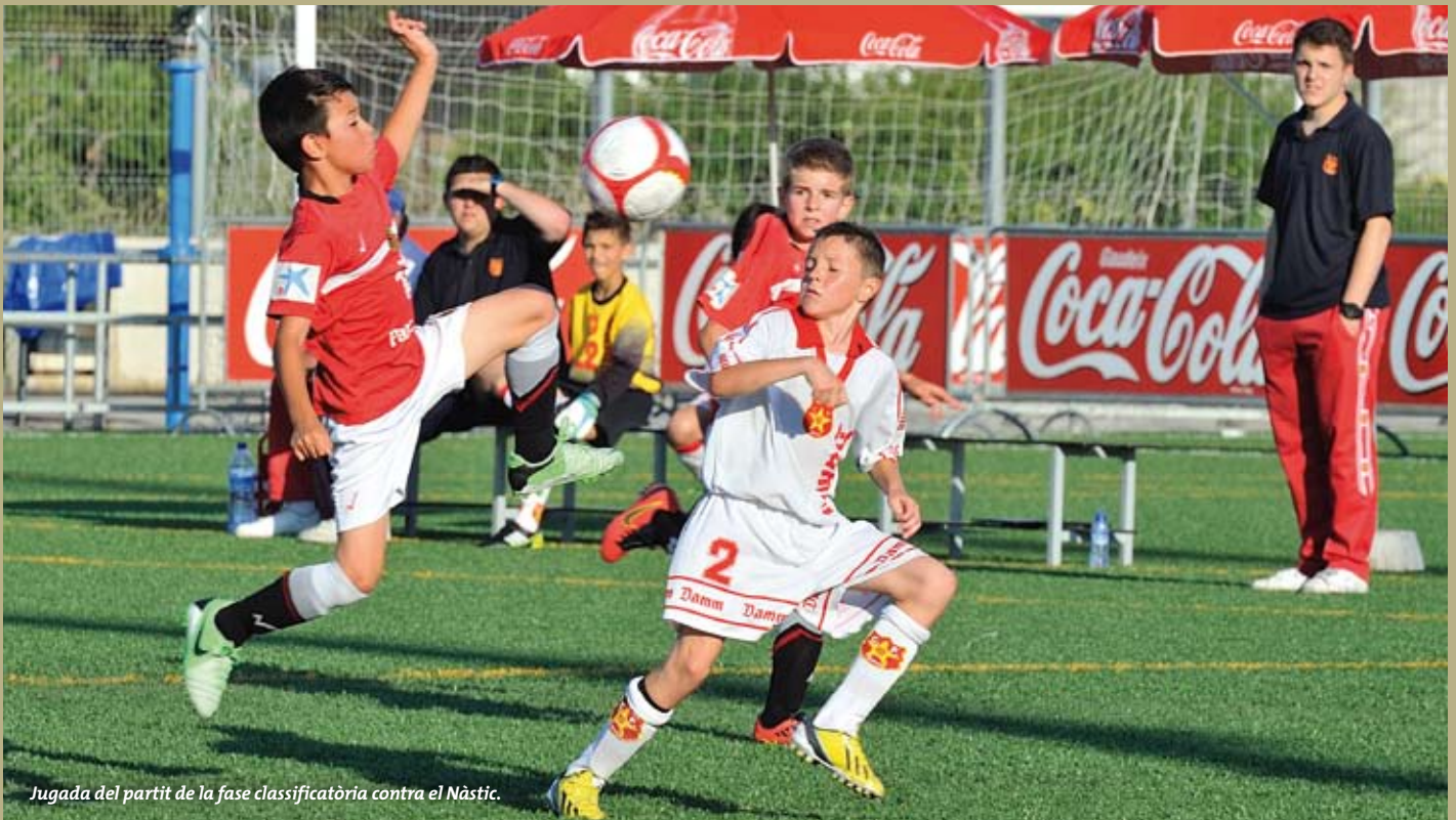
Jugada del partit de la fase classificatòria contra el Nàstic.