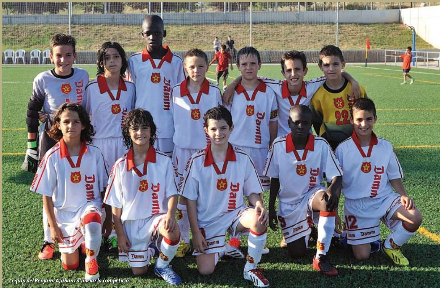
L'equip del Benjamí A, abans d'iniciar la competició.