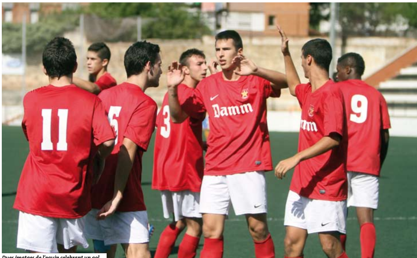
Dues imatges de l'equip celebrant un gol.