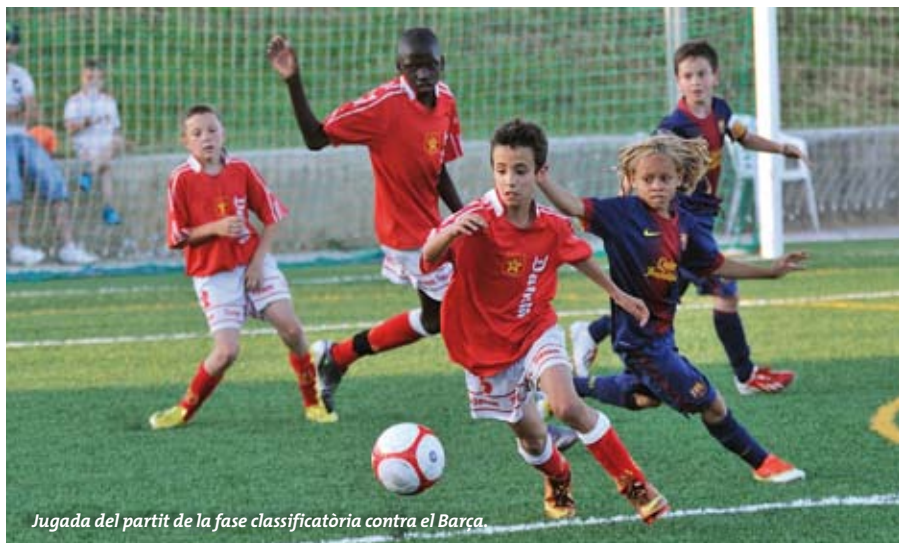
Jugada del partit de la fase classificatòria contra el Barça.

El cap de setmana del 14, 15 i 16 de juny, a l'Estadi Municipal de Futbol de