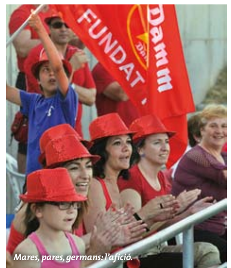
Mares, pares, germans: l'afició.

Als jugadors del benjamí A de la Damm els va acompanyar un grup de familiars que no van deixar d'animar en tot moment l'equip, demostrant el fair play del club i de la seva afició. ■