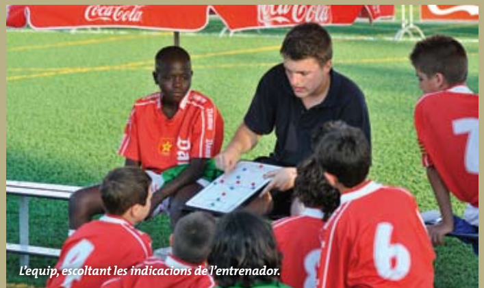
L'equip, escoltant les indicacions de l'entrenador.