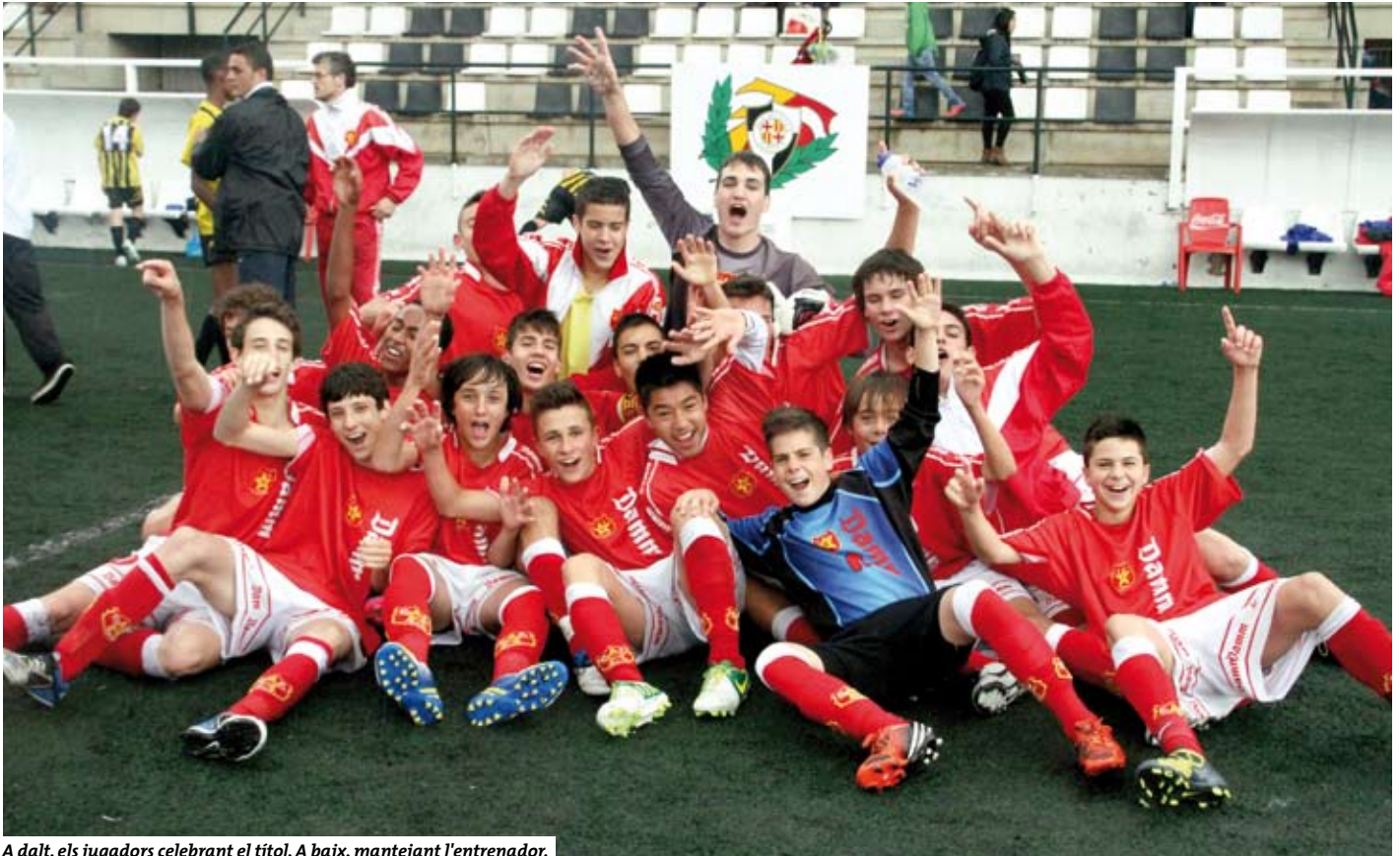
A dalt, els jugadors celebrant el títol. A baix, mantejant l'entrenador.