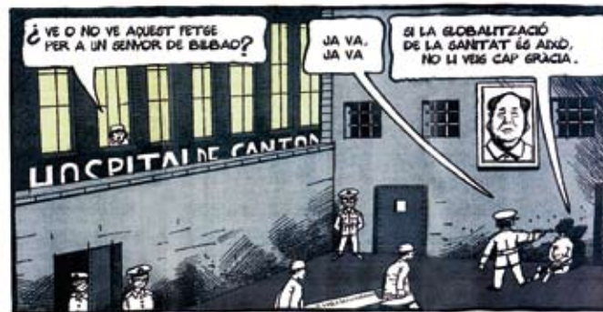
El Periódico, dissabte 27 de març de 2010.

Nota: Agraïm al genial dibuixant, el senyor Ferreres i a la direcció de El Periódico de Catalunya , que ens hagin autoritzat a reproduir la vinyeta que il·lustra aquest article. Els dibuixos del senyor Ferreres, en realitat, són verdaderes editorials, i amb la seva profunditat, ens fan pensar. Gràcies, senyor Ferreres!!!