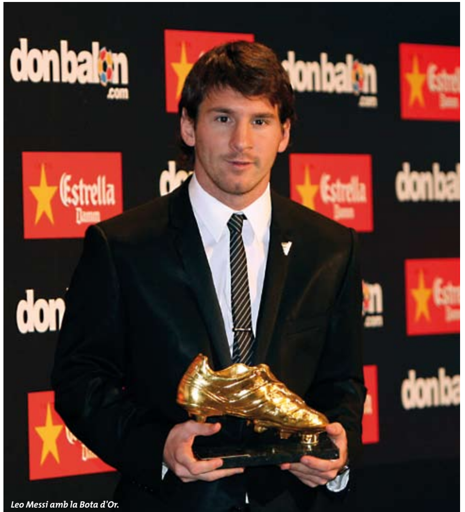
Leo Messi amb la Bota d'Or.

Mentrestant, la munió de gent augmentava i els crits de "Messi, Messi, Messi" eren