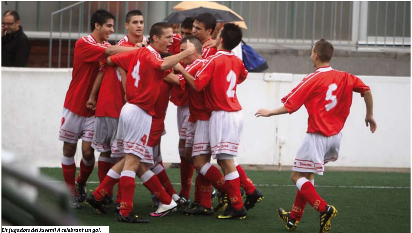
Els jugadors del Juvenil A celebrant un gol.