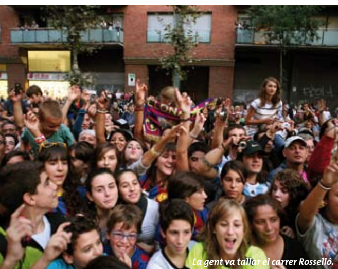
La gent va tallar el carrer Rosselló.