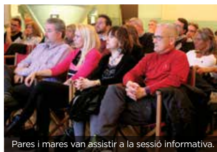
Pares i mares van assistir a la sessió informativa.

DUES EX-CERVESERES I UN EX-CERVESER GAUDEIXEN ACTUALMENT DE LA SEVA ESTADA AL PAÍS NORD-AMERICÀ.