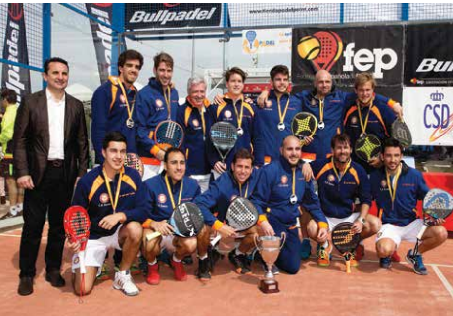
L'equip campió d'Espanya.