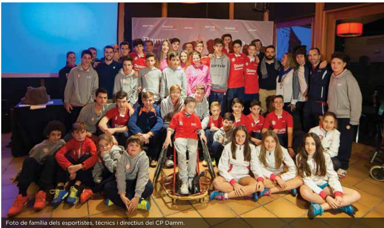
Foto de família dels esportistes, tècnics i directius del CP Damm.