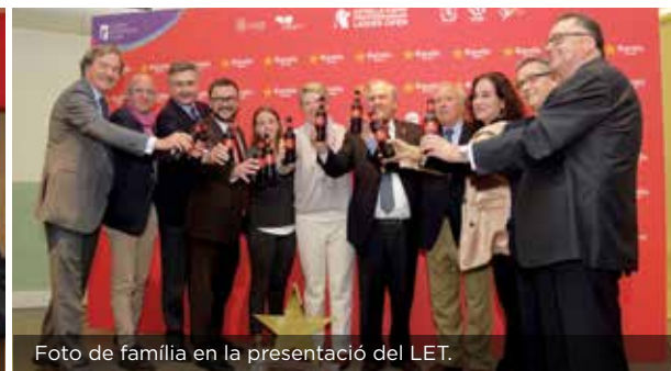
Foto de família en la presentació del LET.