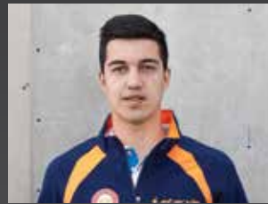
José Carlos Gaspar

Seleccionador Espanyol Absolut (1999-201). Medalla de Plata al Mèrit Esportiu per la FEP (2006).