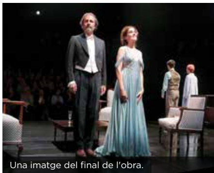
Una imatge del final de l'obra.

La Fundació Damm i el Teatre Nacional de Catalunya, com cada any, van organitzar una funció de teatre exclusiva pels treballadors de la companyia cervesera. D'aquesta manera, la Fundació segueix complint el compromís adquirit d'apropar als treballadors les col·laboracions culturals amb que treballa. En aquest cas va ser mitjançant la representació de l'obra 'La Fortuna de Sílvia', de Josep Maria de Sagarra i dirigida per Jordi Prat. L'obra tracta de l'evolució d'Europa i dels trasbalsos de la Segona Guerra Mundial. ●