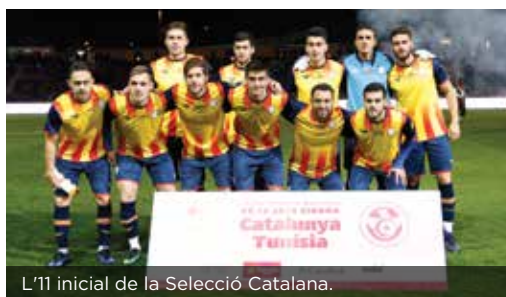
L'11 inicial de la Selecció Catalana.