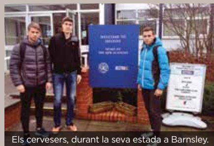
Els cervesers, durant la seva estada a Barnsley.