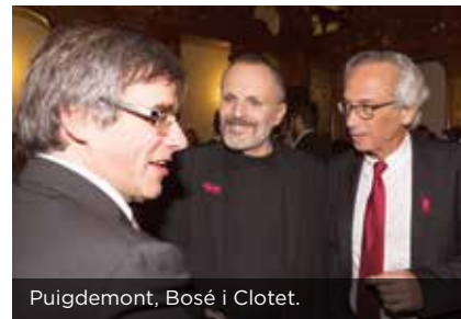
Puigdemont, Bosé i Clotet.