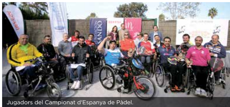
Jugadors del Campionat d'Espanya de Pàdel.