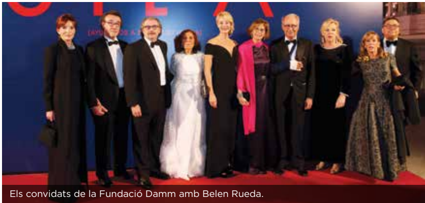
Els convidats de la Fundació Damm amb Belen Rueda.