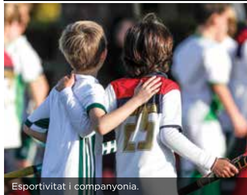
Esportivitat i companyonia.

La Fundació Damm va col·laborar en aquest torneig en la categoria 'Hoquei +', la competició integradora pels jugadors amb la Síndrome de Down.