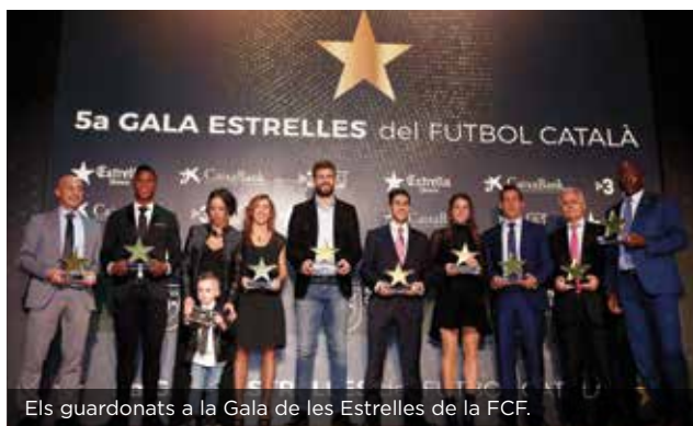
Els guardonats a la Gala de les Estrelles de la FCF.