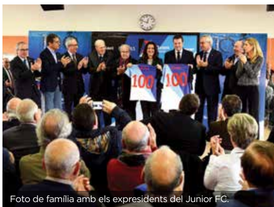
Foto de família amb els expresidents del Junior FC.