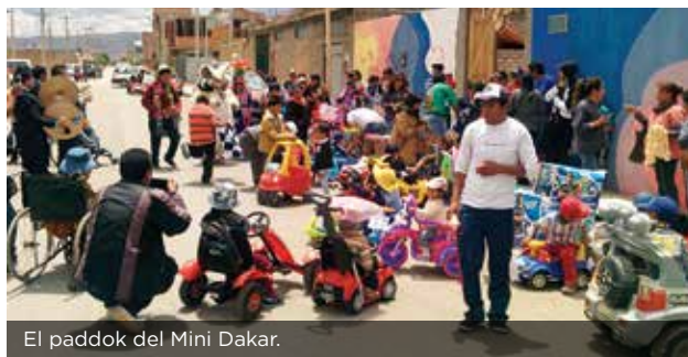
El paddok del Mini Dakar.

L' Associació Khuskan Jaku d'Oruro (Bolívia) va organitzar un Mini Dakar per a nois i noies amb discapacitat física i psíquica. A més, aprofitant el pas del Dakar per la localitat d'Oruro, es va organitzar una trobada amb el pilot Isidre Esteve. Els nois i noies van veure en l'Isidre un exemple de superació i van gaudir molt de l'experiència.