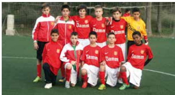
ALEVÍ A | ALEVÍN A