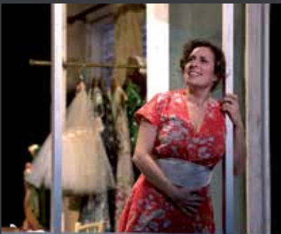
62 TEATRE NACIONAL DE CATALUNYA