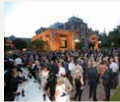
75 BARCELONA GLOBAL