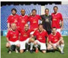
93 INVEST FOR CHILDREN