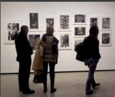
56 MUSEU NACIONAL D'ART DE CATALUNYA