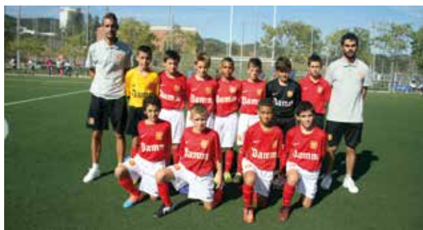
ALEVÍ C | ALEVÍN C