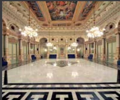
52 GRAN TEATRE DEL LICEU