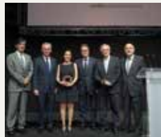
85 FUNDACIÓ FERRO