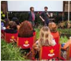
73 ATENEU BARCELONÈS