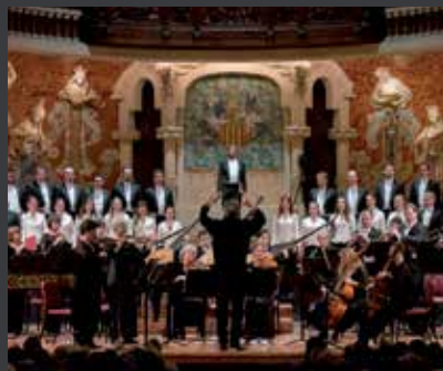
58 PALAU DE LA MÚSICA CATALANA