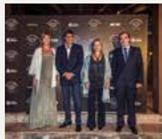
94 MAS DE TORRENT