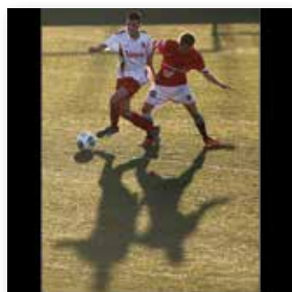
07 JUNI 2015