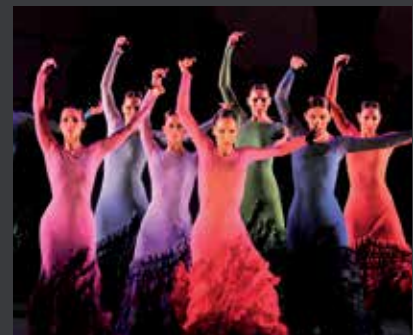
60 TEATRE AUDITORI DE SANT CUGAT