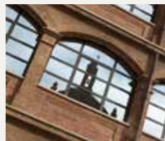
105 UNIVERSITAT ABAT OLIBA