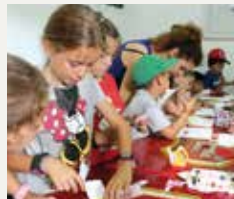
84 FUNDACIÓ ESPORT I EDUCACIÓ BARCELONA