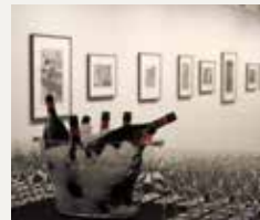
86 FUNDACIÓ FOTO COLECTANIA