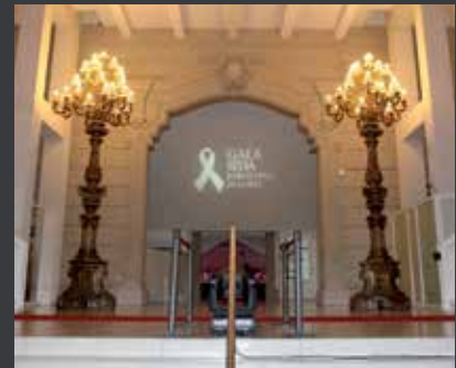
48 FUNDACIÓ LLUITA CONTRA LA SIDA