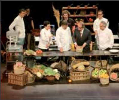
32 ASSOCIACIÓ CASAL D'INFANTS DEL RAVAL