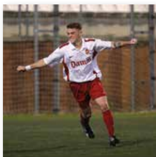
07 AGOST 2015