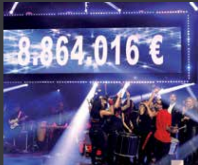
46 FUNDACIÓ LA MARATÓ DE TV3