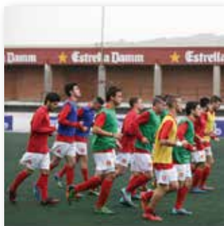
07 FEBRER 2015