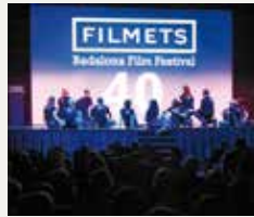
74 BADALONA COMUNICACIÓ - FESTIVAL FILMETS