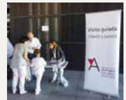
97 REAL ASOCIACIÓN AMIGOS DEL MUSEO REINA SOFIA