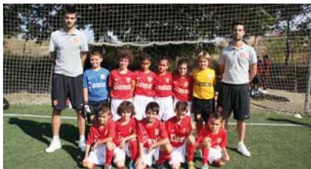
BENJAMÍ B | BENJAMÍN B