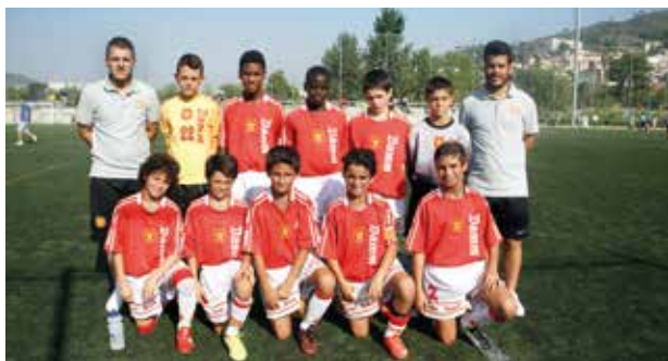
ALEVÍ B | ALEVÍN B