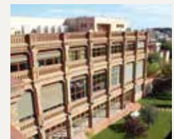
107 UNIVERSITAT RAMON LLULL