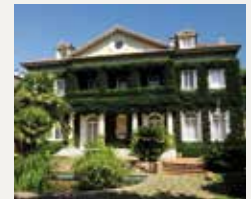
87 FUNDACIÓ IESE