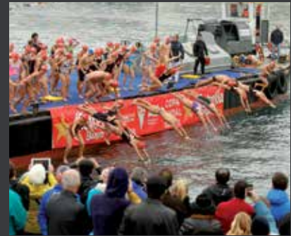
36 CLUB NATACIÓ BARCELONA