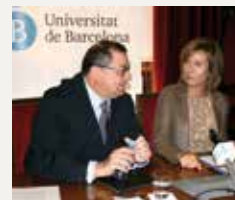
106 UNIVERSITAT DE BARCELONA