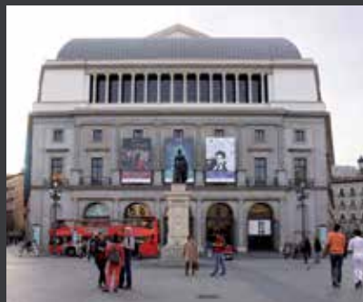
64 TEATRO REAL