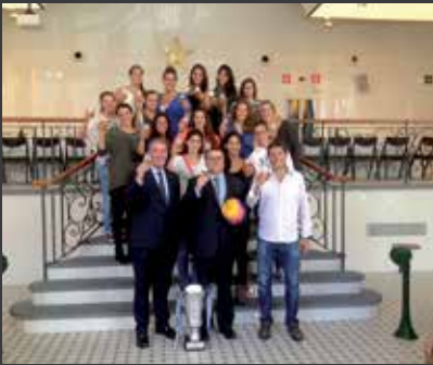
38 CLUB NATACIÓ SABADELL