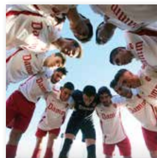
07 MARÇ 2015