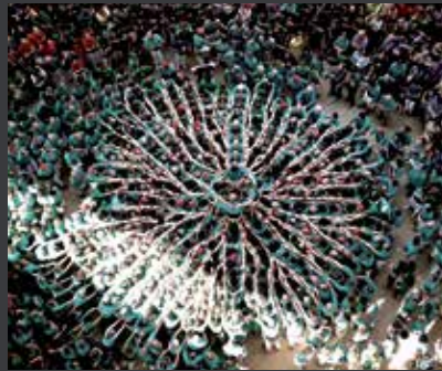
34 CASTELLERS DE VILAFRANCA