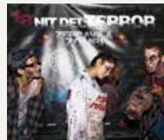
96 NIT DEL TERROR DE SANT CUGAT