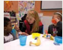
77 CREU ROJA