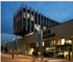
83 FUNDACIÓ ESADE