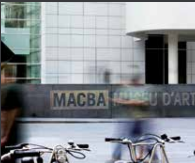
50 FUNDACIÓ MACBA