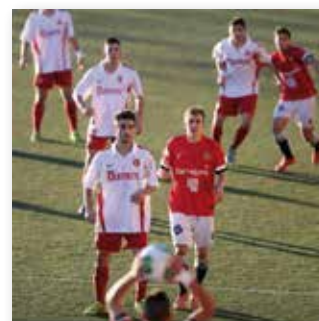
07 SETEMBRE 2015