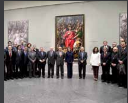
42 EL GRECO: QUART CENTENARI