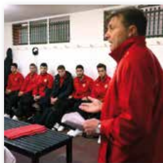
07 JULI 2015