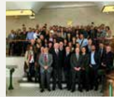
76 CLUB DE GOLF DE SANT CUGAT