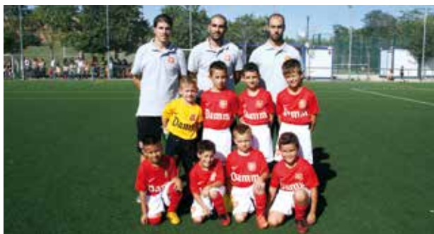
PREBENJAMÍ A | PREBENJAMÍN A

El CF Damm, per la temporada 2014-2015 compta amb 14 equips de futbol en totes les categories, des de la Prebenjamí fins la Juvenil. La gran novetat ha estat la incorporació d'un equip femení, el Juvenil-Cadet, al planter cerveser. El CF Damm, para la temporada 2014-2015 cuenta con 14 equipos de fútbol en todas las categorías, desde la Prebenjamín hasta la Juvenil. La gran novedad ha sido la incorporación de un equipo femenino, el Juvenil-Cadete, en la plantilla cervecera.