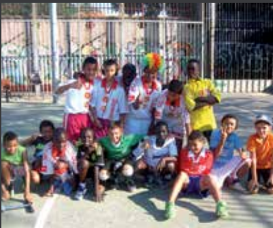
44 ESPORT SOLIDARI INTERNACIONAL