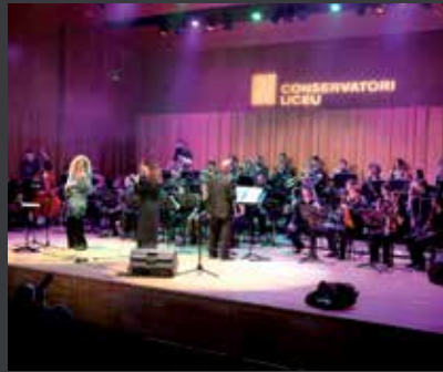
40 CONSERVATORI DEL LICEU