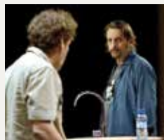
104 TEATRE AUDITORI DE GRANOLLERS