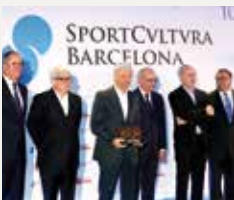
103 SPORT CULTURA BARCELONA