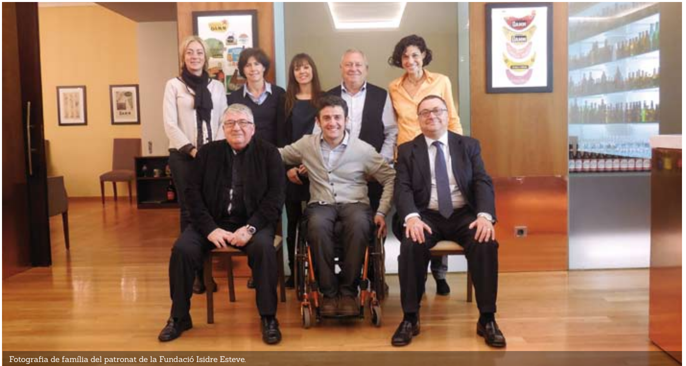
Fotografia de família del patronat de la Fundació Isidre Esteve.