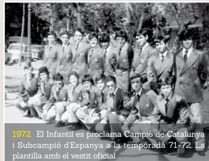
1972. El Infantil es proclama Campió de Catalunya i Subcampió d'Espanya a la temporada 71-72. La plantilla amb el vestit oficial.