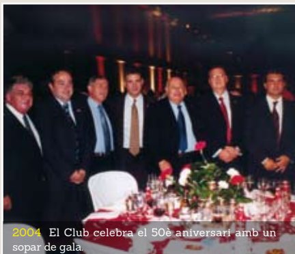
2004. El Club celebra el 50è aniversari amb un sopar de gala.