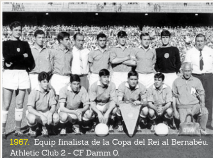
1967. Equip finalista de la Copa del Rei al Bernabéu. Athletic Club 2 - CF Damm 0.