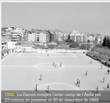
1982. La Damm compra l'antic camp de l'Aeda per 23 milions de pessetes, el 30 de desembre de 1982.