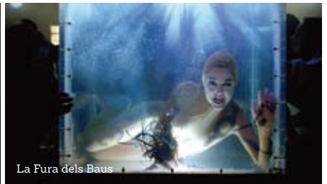
La Fura dels Baus