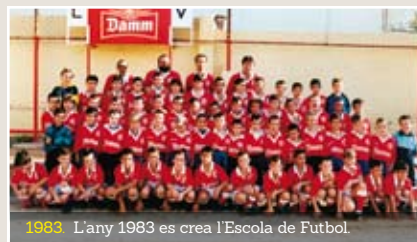
1983. L'any 1983 es crea l'Escola de Futbol.