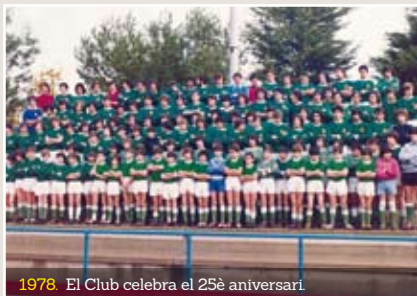
1978. El Club celebra el 25è aniversari.