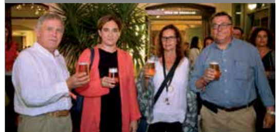
L'alcalde de Barcelona, Ada Colau, no va faltar al concert de la Damm de les festes de La Mercè.