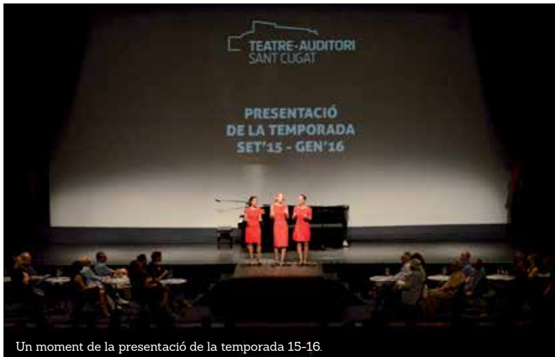
Un moment de la presentació de la temporada 15-16.

El Teatre-Auditori de Sant Cugat va presentar els espectacles de la propera programació: en total 42 espectacles que es podran veure de setembre del 2015 al gener del 2016.