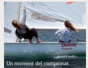
Un moment del campionat.