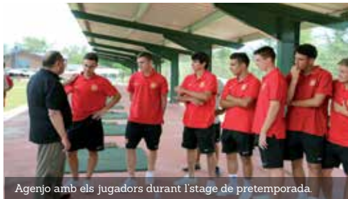
Agenjo amb els jugadors durant l'estage de pretemporada.