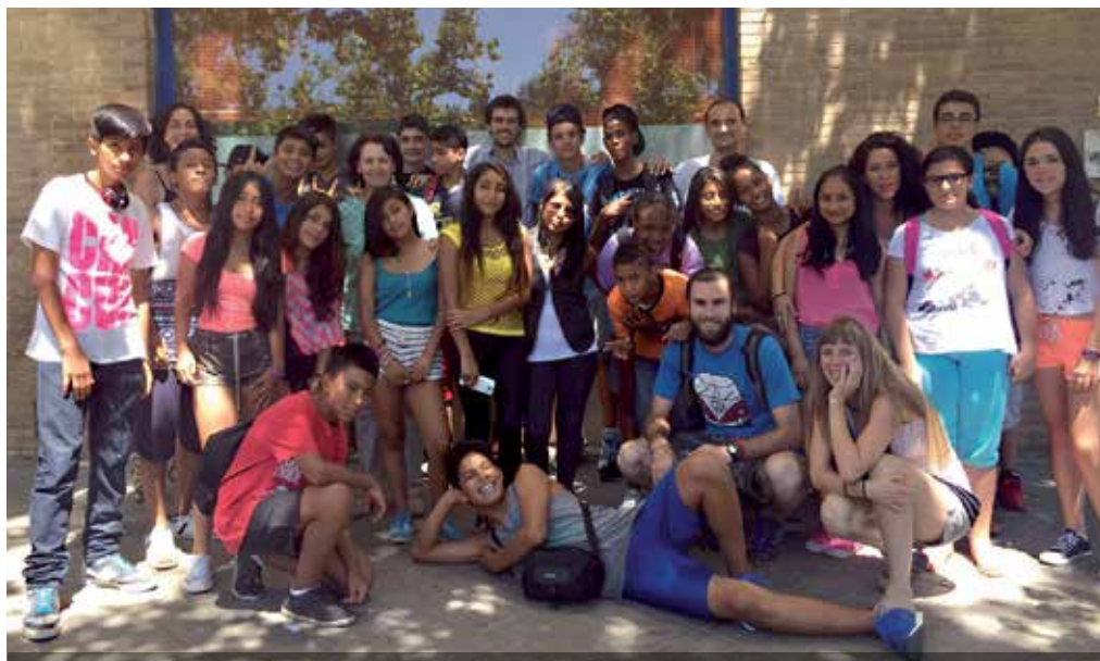
El grup de joves del programa 'Jóvenes y Verano 2015'.