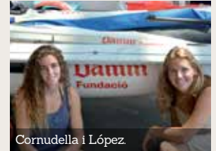
Cornudella i López.