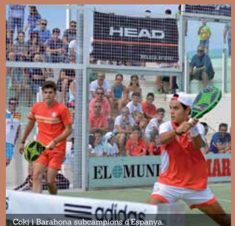
Coki i Barahona subcampions d'Espanya.